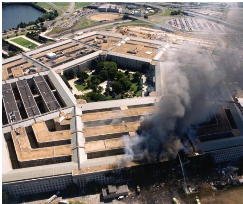
Εικόνα 4: Το Πεντάγωνο μετά την επίθεση

Υπολογίζεται ότι η αεροπειρατεία ξεκίνησε περίπου στις 8:51-8:54 π.μ., μετά από ανακοίνωση του ίδιου του πιλότου. Οι αεροπειρατές μετακίνησαν πάλι τους επιβαίνοντες στο πίσω μέρος του αεροσκάφους, ενώ καμία μαρτυρία δεν αναφέρει κάτι για μαχαιριές, σπρέι ή την απειλή βόμβας. Ο αναμεταδοτής έκλεισε στις 8:54 π.μ., όταν το αεροπλάνο άρχισε να κινείται νότια προς το Πεντάγωνο. Στις 9:37:46 π.μ. το αεροσκάφος πέφτει στο Πεντάγωνο με ταχύτητα περίπου 530 χλμ/ώρα. Όλοι οι επιβαίνοντες μαζί με το στρατιωτικό και πολιτικό προσωπικό του κτιρίου πεθαίνει ακαριαία. (National Commission on Terrorist Attacks Upon the United States, 2004).