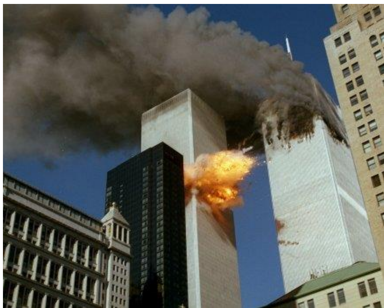
Εικόνα 3: Ο Νότιος Πύργος μετά την επίθεση

Μέσα από τηλεφωνήματα επιβατών από το τηλέφωνο που πίσω θαλάμου του αεροπλάνου, δόθηκαν πληροφορίες για την κατάσταση που επικρατούσε. Οι τεχνικές των αεροπειρατών ήταν ίδιες με εκείνες της Πτήσης 11. Αφού μαχαίρωσαν μερικά μέλη του πληρώματος και σκότωσαν τους πιλότους, απείλησαν για την ύπαρξη βόμβας, έριξαν σπρέι πιπεριού και ανάγκασαν όλα τα μέλη και τους επιβάτες να μετακινηθούν στο πίσω μέρος του αεροπλάνου. Το αεροπλάνο άλλαξε κατεύθυνση προς την Νέα Υόρκη στις 8:58 π.μ. και οι αεροπειρατές το έριξαν στον Νότιο Πύργο του Κέντρου Παγκόσμιου Εμπορίου στις 9:03 π.μ., ο οποίο καταρρέει στις 9:59 π.μ. Οι επιβαίνοντες και δεκάδες υπάλληλοι του Πύργου πεθαίνουν ακαριαία (National Commission on Terrorist Attacks Upon the United States, 2004).