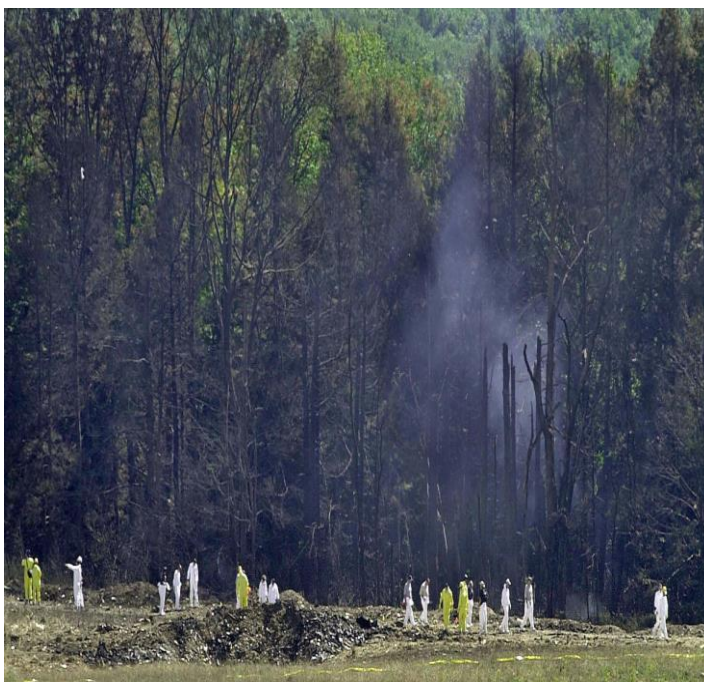
Εικόνα 5: Το σημείο πρόσκρουσης της πτήσης 93

Πληροφορίες που έχουν συλλεχθεί από τηλεφωνήματα των επιβατών υποστηρίζουν πως οι αεροπειρατές φορούσαν κόκκινες μπαντάνες στο κεφάλι και κρατούσαν μαχαίρια. Η επικοινωνία των επιβατών μέσω τηλεφώνου τους επέτρεψε να ενημερωθούν για τις τρομοκρατικές επιθέσεις που είχαν ήδη γίνει στους Πύργους. Οι ίδιοι άρχισαν να περιγράφουν πως επιθυμούσαν να επιτεθούν στους αεροπειρατές και να ανακαταλάβουν το αεροπλάνο, ώστε να σταματήσουν τα σχέδια τους για ένα ακόμα χτύπημα σε ομοσπονδιακό κτίριο. Ο πρώτος επιβάτης έκανε την αρχή στις 9:57 π.μ. και στην συνέχεια συμμετείχαν και οι υπόλοιποι. Ο Jarrah ως πιλότος πλέον, θέλοντας να αποτρέψει την επίθεση των επιβαινόντων προκάλεσε αναταράξεις για να χάσουν την ισορροπία τους. Η προσπάθεια ήταν μάταιη, αφού οι επιβάτες δεν τα παράτησαν. Τότε ο Jarrah βλέποντας πως απέχουν λίγα λεπτά από το να καταλάβουν το πιλοτήριο αποφασίζει να ρίξει το αεροπλάνο σε ένα άδειο χωράφι στην Πενσυλβάνια, πηγαίνοντας με 580 χλμ./ώρα. Πιθανός στόχος των αεροπειρατών ήταν το Καπιτώλιο ή ο Λευκός Οίκος, αλλά χάρη στην δράση των επιβατών η συγκεκριμένη αποστολή απέτυχε (National Commission on Terrorist Attacks Upon the United States, 2004).