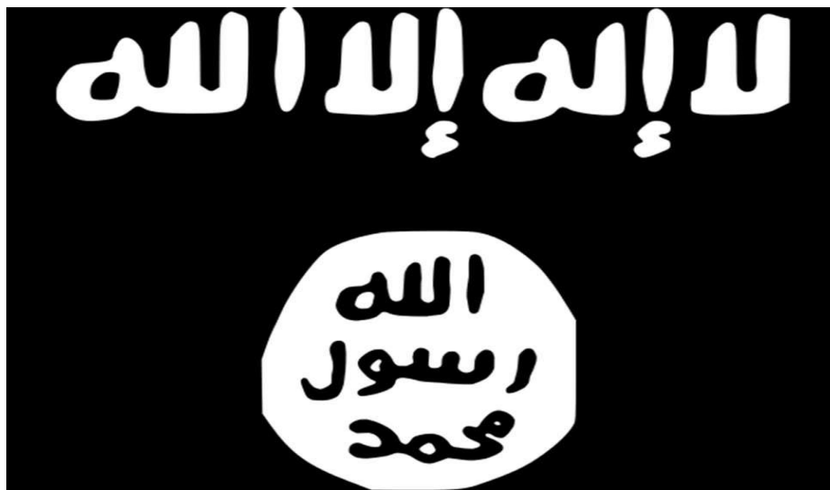
Εικόνα 6: Η σημαία του ISIS

του ISIS 17 . Παρακινεί όλους τους μουσουλμάνους παγκοσμίως να δηλώσουν υποταγή στον «ηγέτη των πιστών», Abu Omar al-Baghdadi, ενώ ένα μήνα αργότερα ανακοινώνει την διάλυση της Al-Qaeda του Ιράκ, δηλώνει και ο ίδιος υποταγή στον Omar al-Baghdadi και απορροφάει όλους τους μαχητές στο ISIS (McCants, 2017).