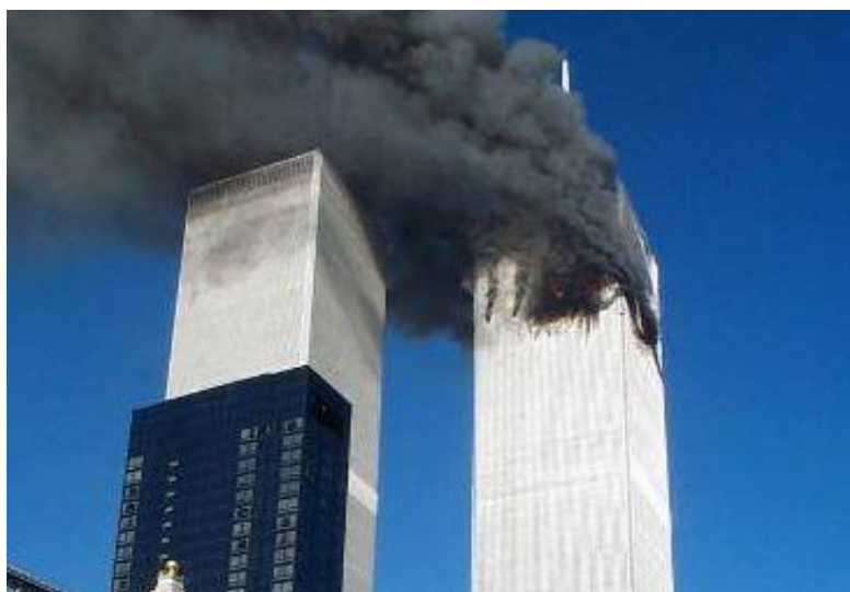
Εικόνα 2: Ο Βόρειος Πύργος μετά την επίθεση

Οι τρομοκράτες μάλλον δεν γνώριζαν καλά το σύστημα επικοινωνίας του πιλοτηρίου, και αντί να μεταδίδουν τα μηνύματά τους στο κανάλι της καμπίνας, τα μετέδιδαν στο κανάλι ελέγχου της εναέριας κυκλοφορίας. Αυτό έδωσε την ευκαιρία στα μέλη του πληρώματος να δίνουν πληροφορίες για την κατάσταση που επικρατεί, αλλά και για τους ίδιους τους αεροπειρατές, πώς μοιάζουν, σε ποιες θέσεις κάθονταν, ποια είναι τα ονόματά τους. Στις 8:38 π.μ. μέλος του πληρώματος ενημέρωσε στον ασύρματο ότι το αεροσκάφος πετάει πολύ ανώμαλα, αλλάζοντας κατεύθυνση, με πιθανό προορισμό το αεροδρόμιο JFK της Νέας Υόρκης, ενώ στις 8:44 π.μ. ενημέρωσε πως πετάνε πάρα πολύ χαμηλά. Στις 8:46:40 π.μ. οι αεροπειρατές ρίχνουν το αεροσκάφος στον Βόρειο Πύργο του Κέντρου Παγκόσμιου Εμπορίου στη Νέα Υόρκη, η κατάρρευση του οποίου έγινε στις 10:28 π.μ. Όλοι οι επιβαίνοντες μαζί με έναν μεγάλο αριθμό εργαζομένων του Πύργου πεθαίνουν ακαριαία (National Commission on Terrorist Attacks Upon the United States, 2004).