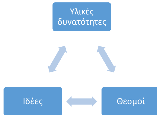
Σχήμα 1: Οι τρεις σφαίρες δραστηριότητας κατά τον Cox

Οι υλικές δυνάμεις, ή δυνατότητες, είναι ο συσσωρευμένος πλούτος, οι πόροι και ο εξοπλισμός, οι «τεχνολογικές και οργανωτικές δυνατότητες», όπως τις ονομάζει ο Cox. Οι ιδέες, όπως είναι αναμενόμενο, είναι το πεδίο μέσα στο οποίο φαίνεται να συντελείται η πάλη για τον μετασχηματισμό της δομής, είναι είτε «διωποκειμενικά νοήματα, [...] κοινές έννοιες περί της φύσεως των κοινωνικών σχέσεων», είτε «συλλογικές εικόνες της κοινωνικής τάξης που έχουν διαφορετικές ομάδες ανθρώπων». Τέλος, οι θεσμοί λειτουργούν ως το συγκολλητικό στοιχείο των ιστορικών δομών, που συνενώνουν εντός τους τις ιδέες και τις υλικές δυνάμεις. Τα τρία πεδία ανθρώπινης δραστηριότητας, που μαζί συναπαρτίζουν μία δομή με συγκεκριμένα χαρακτηριστικά ανάλογα με την ιστορική περίοδο, έχουν διαλεκτική και ανατροφοδοτική σχέση μεταξύ τους, και επ' ουδενί δεν έπεται το ένα του άλλου αιτιοκρατικά (Budd, 2013, σσ. 24-25). Ο λόγος για τον οποίο οι «θεωρίες επίλυσης προβλημάτων», που αναφέρθηκαν προηγουμένως, δεν στάθηκαν ικανές να προβλέψουν τη λήξη του Ψυχρού Πολέμου οφείλεται κατά τον Cox στο γεγονός ότι αδυνατούν να συλλάβουν την «τριαδική» φύση της δομής που πλαισιώνει την ανθρώπινη δραστηριότητα, και της επακόλουθης επικέντρωσής τους σε μία από τις πτυχές της, εξάγοντας συμπεράσματα τα οποία είναι ελλιπή και βασισμένα στις προκαταλήψεις που αφορούσαν τον Ψυχρό Πόλεμο (Cox, 1981, σ. 89).