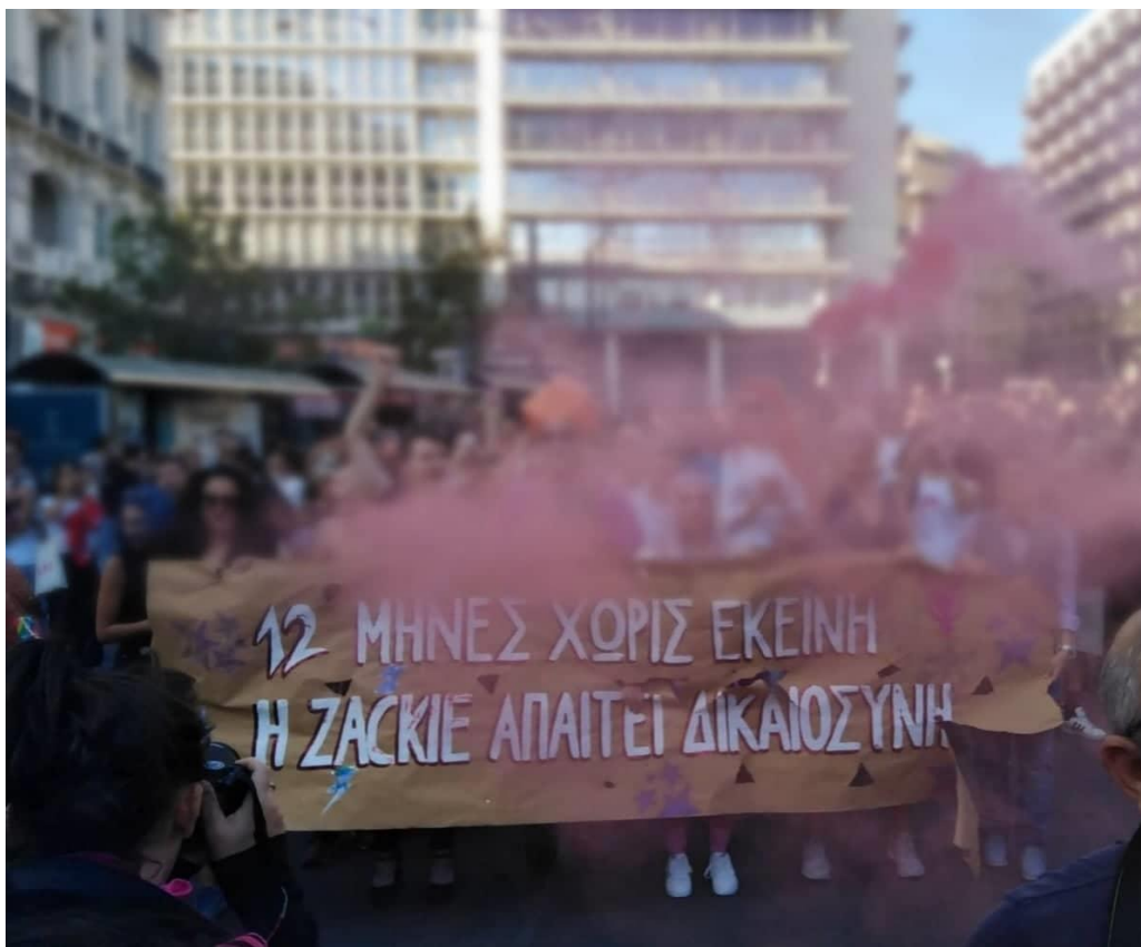
Φωτογραφία: Μαρία Μάζη, 2019