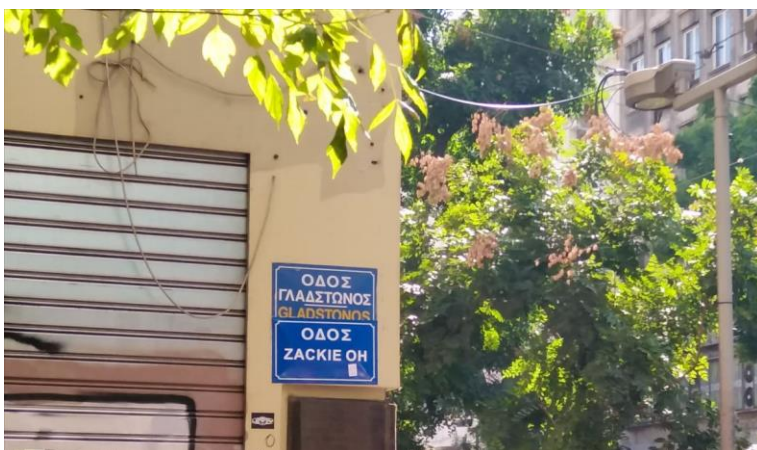
Φωτογραφία: Μαρία Μάζη, 2019