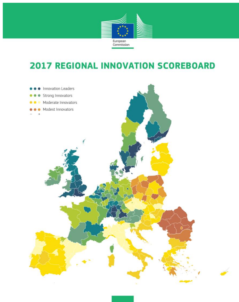
Εικόνα 3 [Budget Invest EU 2021 – 2027]

αποτελεσμάτων της Ευρωπαϊκής Περιφερειακής Καινοτομίας υποδηλώνει ότι η αριστεία της καινοτομίας εξακολουθεί να επικεντρώνεται μόνο σε μικρό αριθμό περιφερειών.