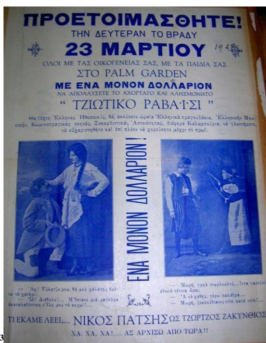
Εικόνα 5 13