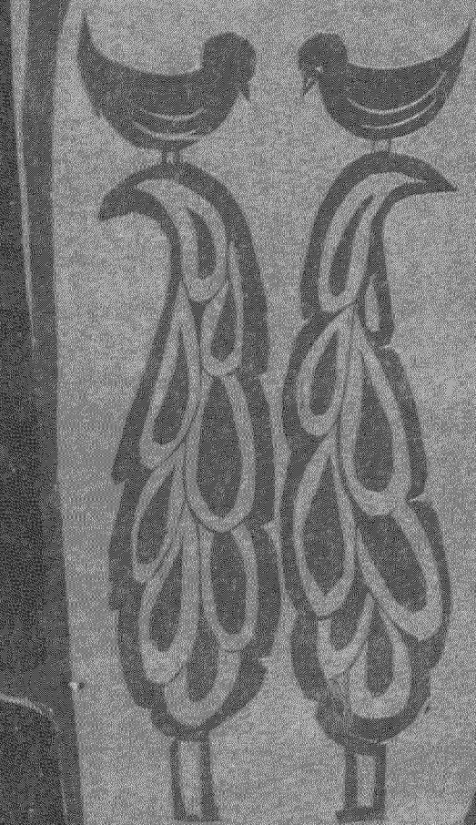
Αρισ Κομιανού, Σύνθεση Νο 64, 1977