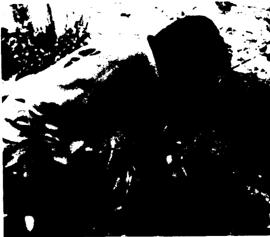
Ο Ρόρρος στον κήπο του, φωτ. 1967

1. Γνωστή η επίμονη ενασχόληση του Θεοδωρίδη με το έργο του Επίκουρου (τον καιρό της καθηγεσίας του στη Θεσσαλονίκη και της συγγραφικής εργασίας του μετά την απόλυσή του το 1947). Σχετικό άρθρο σε άλλες σελίδες τούτου του τεύχους.