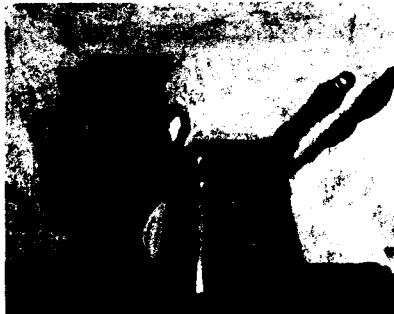
Λ. Ρόρρος, Σύνθεση με κανατάκι χιώτικο, 1967

Μα κι απ' άλλες πλευρές ξεχύνονται τα κύματα. Ολόκληρη η πολιτική κι ο αντίλαλός της η λογοτεχνία στην πλειονότητα είναι έγκλημα καθοσίωσης στην ιερότητα του Λόγου.