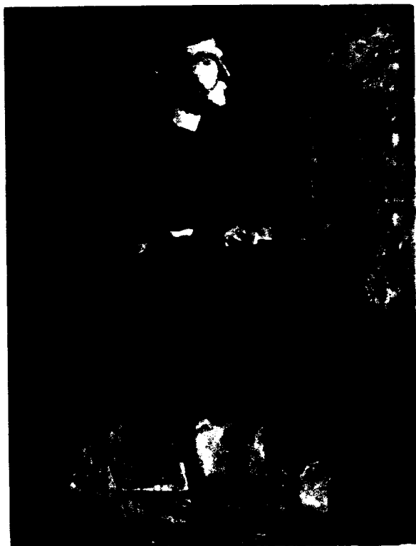
Α. Ρόρρος, Φοιτητής μοντέλο, 1962

45. Αν. Φραγκουδάκη, Εκπαιδευτική Μεταρρύθμιση και Φιλελεύθεροι Διανοούμενοι , Κέδρος, Αθήνα 1977, σ. 91.