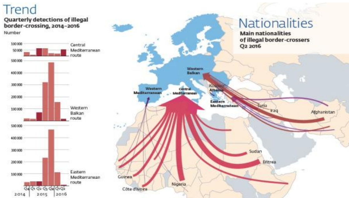
Εικόνα 2. Πηγή Frontex. Risk Analysis Network (FRAN) Quarterly Report 2016.