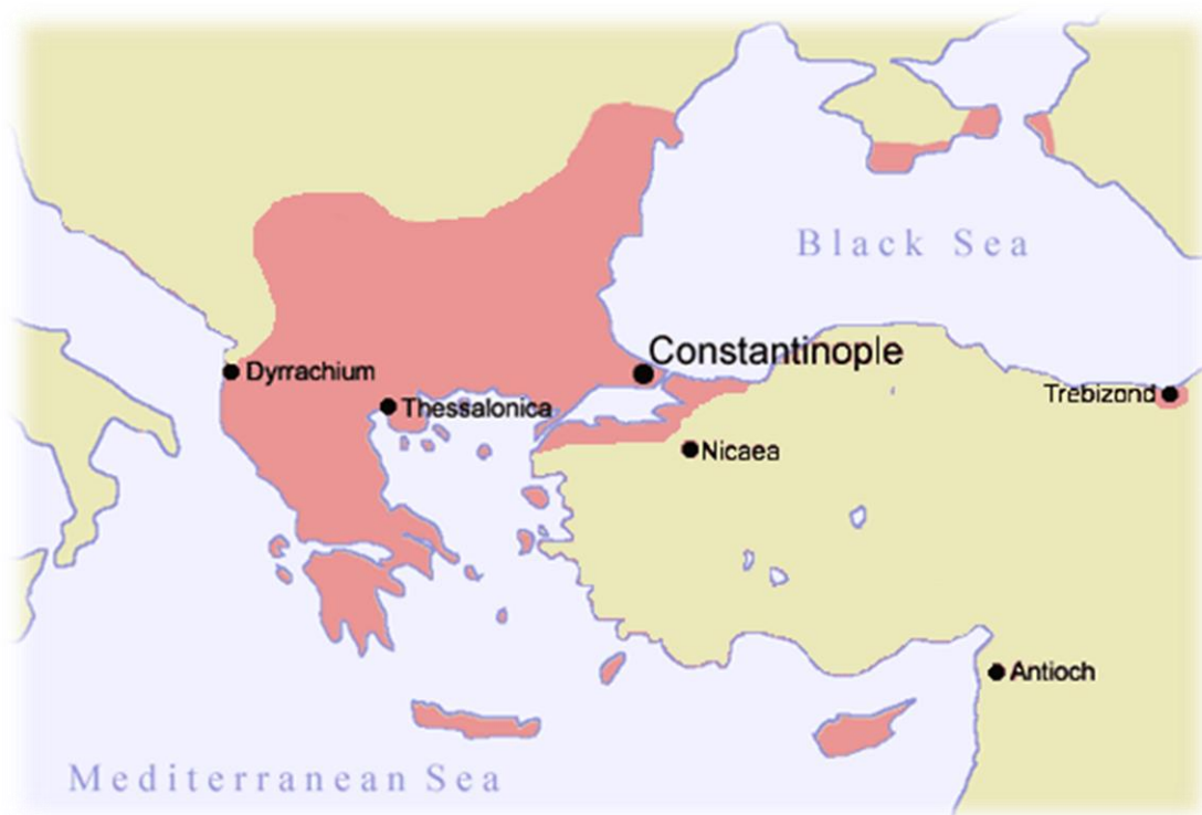
Το Βυζάντιο κατά την άνοδο του Αλέξιου Κομνηνού στην εξουσία (1081)

Η καθοδική αυτή πορεία τερματίστηκε με την άνοδο στην εξουσία του Αλέξιου Α' Κομνηνού, ο οποίος προερχόταν από την στρατιωτική αριστοκρατία της Μικράς Ασίας. Ο Αλέξιος Α' κατάφερε να αναδιοργανώσει τον στρατό, την οικονομία και να επεκτείνει την βυζαντινή επιρροή, κυρίως στα Βαλκάνια και λιγότερο στην Μικρά Ασία. Με την βοήθεια των Βενετών κατάφερε να αποκρούσει τον κίνδυνο των Νορμανδών ενώ με την βοήθεια των Σταυροφόρων κατάφερε να ανακτήσει τις πιο εύφορες περιοχές της Μ. Ασίας από τους Σελτζούκους, χωρίς να καταφέρει όμως να τους εκτοπίσει από το κεντρικό το οροπέδιο της Ανατολίας. Η ανυψωτική όμως αυτή προσπάθεια του Αλέξιου Α' Κομνηνού και των διαδόχων του δεν επανέφερε το Βυζάντιο στην επιβλητική θέση που κατείχε κατά την διάρκεια της Μακεδονικής δυναστείας. Έδωσε όμως μία ανάσα στην παραπαίουσα αυτοκρατορία σε μία εποχή που οι κίνδυνοι από το Ισλάμ στην ανατολή και από την ανερχόμενη δυτική Ευρώπη άρχισαν να μεγαλώνουν.