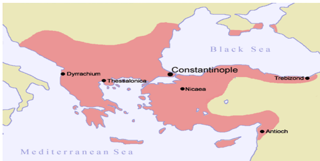
Η Βυζαντινή Αυτοκρατορία το 1180, μετά τον θάνατο του Μανουήλ Κομνηνού

καιρό και η αδυναμία του αυτοκράτορα να τηρήσει τις δεσμεύσεις του τους οδήγησε στον να λεηλατούν την ύπαιθρο γύρω από την βυζαντινή πρωτεύουσα. Τον Ιανουάριο του 1204 η υπομονή των Βυζαντινών εξαντλήθηκε και ο Αλέξιος Δ΄, αντιμέτωπος με συνεχείς ταραχές, ζήτησε την βοήθεια των Σταυροφόρων. Αιχμαλωτίστηκε όμως από τον Αλέξιο Δούκα, ο οποίος πρωτοστάτησε στις εξεγέρσεις εναντίον του φιλολατίνου αυτοκράτορα Αλέξιου Δ' και κατόρθωσε, με τη βοήθεια των Βαράγγων, να ανεβεί στο θρόνο και να στεφθεί αυτοκράτορας με το όνομα Αλέξιος Ε΄. Λίγες μέρες αργότερα εκτέλεσε τον αιχμάλωτο Αλέξιο, αφού εν τω μεταξύ είχε πεθάνει και ο Ισαάκ Άγγελος. Με τα νέα αυτά δεδομένα, οι Σταυροφόροι αποφάσισαν να κυριεύσουν την Κωνσταντινούπολη. Στις αρχές Απριλίου έκαναν την πρώτη τους έφοδο στην Πόλη, η οποία αποκρούστηκε. Λίγες μέρες αργότερα όμως, επανέλαβαν την επίθεση τους και μετά από ολιγοήμερη αντίσταση, κατόρθωσαν να καταλάβουν την Κωνσταντινούπολη, η οποία ποτέ μέχρι τότε δεν είχε πέσει στα χέρια ξένων. Ο Αλέξιος Ε' Δούκας εγκατέλειψε την πρωτεύουσα, ενώ το μεγαλύτερο κομμάτι της βυζαντινής ελίτ, ανάμεσα τους και ο Θεόδωρος Λάσκαρης, διέφυγαν στην Νίκαια. Οι νικητές, εισβάλλοντας στην Κωνσταντινούπολη επιδόθηκαν σε ένα όργιο σφαγών, λεηλασιών και βιασμών που δεν είχε ξαναδεί η βυζαντινή πρωτεύουσα. Η κατάληψη της Κωνσταντινούπολης από τους Σταυροφόρους δεν έφερε το τέλος της αυτοκρατορίας, ήταν όμως ένα χτύπημα από το οποίο το Βυζάντιο δεν συνήλθε ποτέ. 43