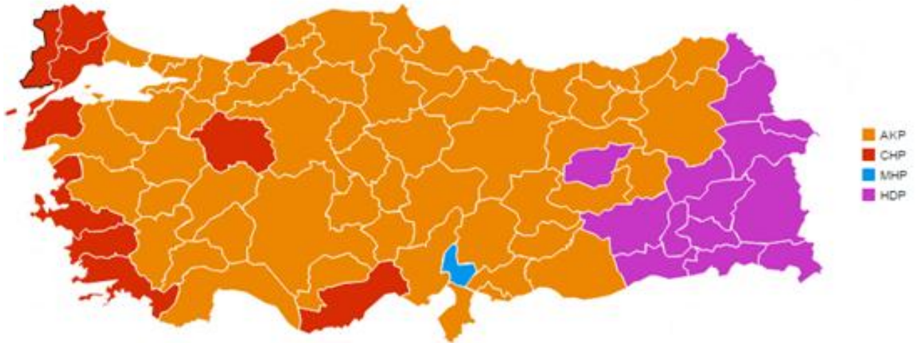
Figure 1. Political map of Turkey after the 2015 elections