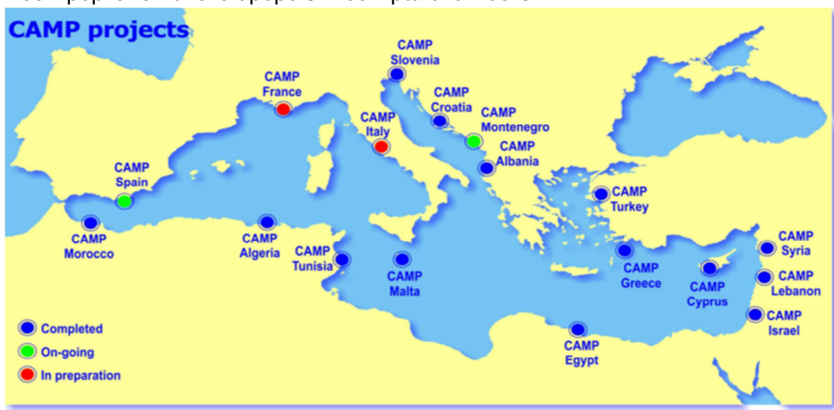
Εικόνα 1 - Χάρτης Μεσογείου που απεικονίζει τα CAMPs

Το PAP/ RAC, εδρεύει στο Σπλιτ της Κροατίας και ασχολείται με την ολοκληρωμένη διαχείριση των παράκτιων ζωνών και την οικιστική ανάπτυξη. Το κέντρο προσφέρει τεχνικές υπηρεσίες και συντονίζει το πρόγραμμα διαχείρισης παράκτιων περιοχών (CAMPs). Το PAP/RAC παρέχει βοήθεια στα μεσογειακά κράτη για την εφαρμογή του άρθρου 4 της σύμβασης της Βαρκελώνης, συναντώντας τις υποχρεώσεις των μερών για το πρωτόκολλο ICZM, την εφαρμογή της Μεσογειακής Στρατηγικής για τη Βιώσιμη Ανάπτυξη (MSSD) και πραγματοποιώντας τις εργασίες που προβλέπονται στο άρθρο 32 του Πρωτοκόλλου ΟΔΠΖ.