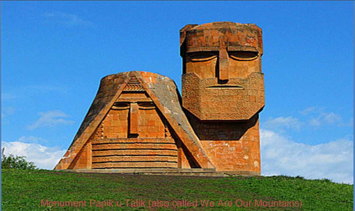
Monument Papik u Tatik (also called We Are Our Mountains)

ΠΡΟΓΡΑΜΜΑ ΜΕΤΑΠΤΥΧΙΑΚΩΝ ΣΠΟΥΔΩΝ «ΣΤΡΑΤΗΓΙΚΕΣ ΣΠΟΥΔΕΣ ΑΣΦΑΛΕΙΑΣ»