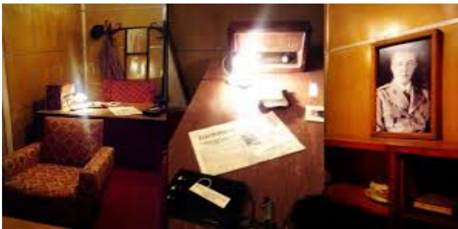
εικ. 18. Λεπτομέρειες από το γραφείο του Enver Hoxha, το οποίο αποτελεί μέρος των μουσειακών ενότητων του Bunk'Art.

Εστιάζοντας στη διαδικασία μετατροπής του Bunk'Art σε εκθεσιακό – μουσειακό πολυχώρο, φαίνεται ότι η αρχιτεκτονική του έχει διατηρηθεί, ενώ οι εσωτερικοί χώροι έχουν διαμορφωθεί ειδικά, ώστε να φιλοξενήσουν τις εκθεσιακές ενότητες στις οποίες παρουσιάζονται τόσο μουσειακά και ιστορικά, όσο και καλλιτεχνικά θέματα. Πιο συγκεκριμένα, ως προς τις καλλιτεχνικές ενότητες, αυτές χρησιμοποιούν κατά βάση video-art εγκαταστάσεις (video-art installations), ήχοι, φως και εικόνα, θέλοντας, όπως υποστηρίζεται, να δημιουργήσουν ένα ιστορικό και συναισθηματικό ταξίδι στους επισκέπτες. Ως προς τις μουσειακές ενότητες, αυτές αναφέρονται στην μουσειοποίηση ορισμένων από τους προσωπικούς χώρους της τότε κομμουνιστικής ηγεσίας, μεταξύ των οποίων περιλαμβάνονται το δωμάτιο του Enver Hoxha και αυτό του τότε Πρωθυπουργού της χώρας, Mehmet Shehu. Αν και στο σύνολό τους φαίνεται να έχουν διατηρηθεί ανέπαφα, έχουν προστεθεί ορισμένα «αυθεντικά» αντικείμενα εποχής, τα οποία δεν ανήκαν στο χώρο, γεγονός το οποίο φαίνεται να τους προσδίδει περισσότερο διακοσμητικό χαρακτήρα.