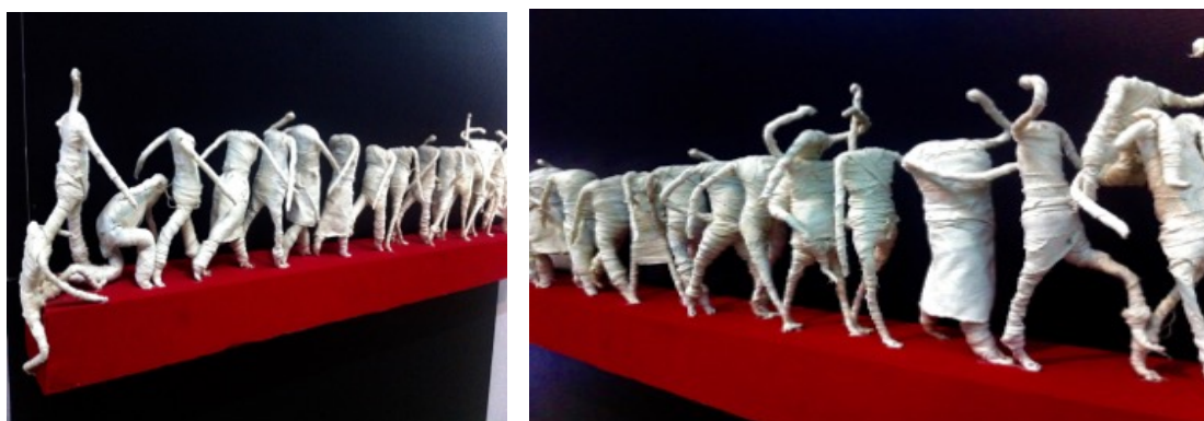
εικ. 11. Λεπτομέρειες από την εικαστική παρέμβαση των φοιτητών της Σχολής Καλών Τεχνών.

Ήδη από τα παραπάνω γίνεται σαφές ότι είναι μάλλον δύσκολο να μιλήσει κανείς για μια σύγχρονη μουσειολογική προσέγγιση του θέματος, ωστόσο η εικαστική παρέμβαση από ομάδα φοιτητών της Σχολής Καλών Τεχνών των Τιράνων, έδειχνε να προκαλεί δημιουργικά στο χώρο, εγείροντας ερωτήματα, προβληματίζοντας και επιτρέποντας την νοητική και συναισθηματική εμπλοκή του επισκέπτη ανάλογα με τις εμπειρίες του.