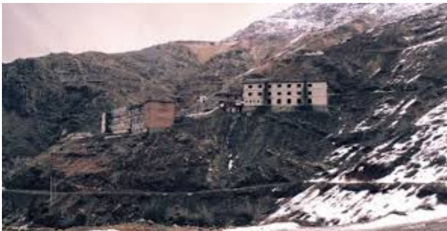
εικ. 13. Burgu I Sracit : Περιβάλλον χώρος της φυλακής του Srac στη περιοχή Miridita της Αλβανίας.