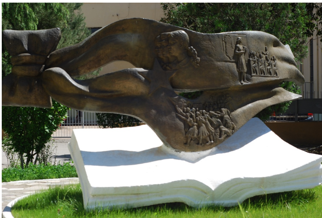
εικ. 1. Αγαλμα της περιόδου έξω από σχολικό συγκρότημα της πόλης των Τιράνων

συνείδηση (Βίκερς και Πέτιφερ 1998: 17), θα οικοδομούσε τη «νέα σοσιαλιστική κοινωνία» της Αλβανίας.