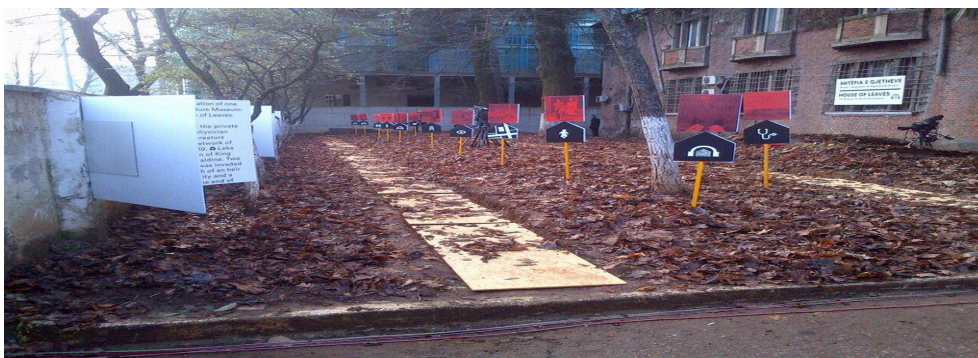
εικ. 19. Εικόνα από την εναρκτήρια φωτογραφική έκθεση του Gjethi στην μπροστινή αυλή του κτηρίου.

Την ίδια χρονιά, δηλαδή το 2014, άνοιξε συμβολικά και για περιορισμένο κοινό το Shteria e Gjethëve (Το σπίτι των φύλλων), όπου μέσα από μια υπαίθρια φωτογραφική έκθεση, οι επιμελητές παρουσίασαν τις βασικές ενότητες που πρόκειται να συμπεριληφθούν κατά τη μετατροπή του κτηρίου αυτού σε μουσείο.