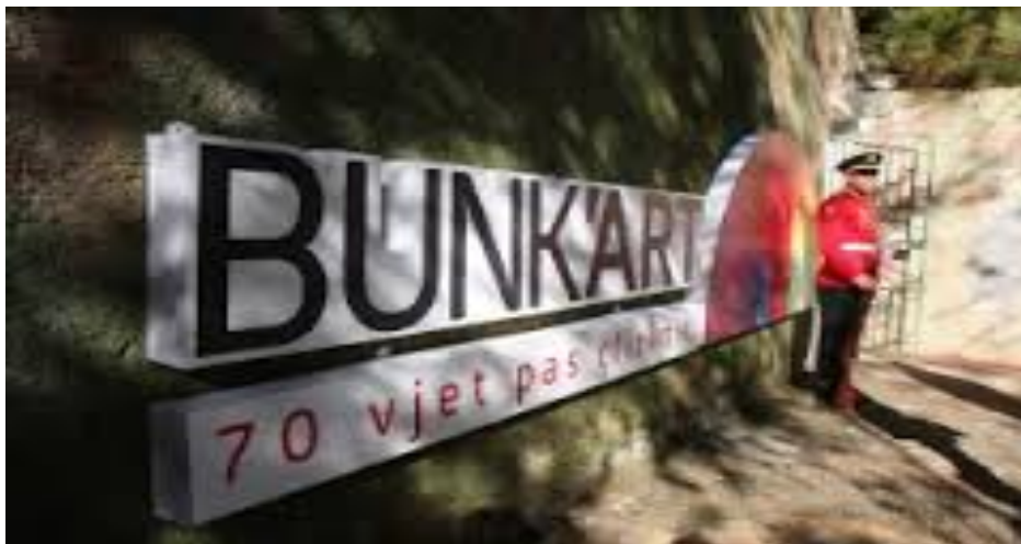
εικ. 16. Λεπτομέρεια από την κεντρική είσοδο στο Bunk'Art.

Το 2014, με κυβερνητική πρωτοβουλία εγκαινιάζεται, λίγα μόλις χιλιόμετρα μακριά από το κέντρο της πόλης των Τιράνων, το Bunk'Art 32 , για να συμβολίσει, σύμφωνα με τους υπευθύνους του, την απομόνωση της κομμουνιστικής Αλβανίας, αλλά και τις συνεχείς αντιπαραθέσεις του κομμουνιστικού μπλοκ με τη Δύση κατά τη διάρκεια του Ψυχρού Πολέμου. Ουσιαστικά πρόκειται για τη μουσειοποίηση μιας στρατιωτικής εγκατάστασης – ενός υπόγειου αντι-ατομικού καταφυγίου πέντε ορόφων, τύπου Bunker, το οποίο διαθέτει 106 δωμάτια και μια τεράστια αίθουσα Εθνοσυνέλευσης. Κατασκευασμένο περί το 1970 από το κομμουνιστικό κράτος, το εν λόγω Bunker προβλεπόταν να προστατεύει την τότε ηγεσία του κόμματος, σε ενδεχόμενη χημική ή πυρηνική επίθεση.