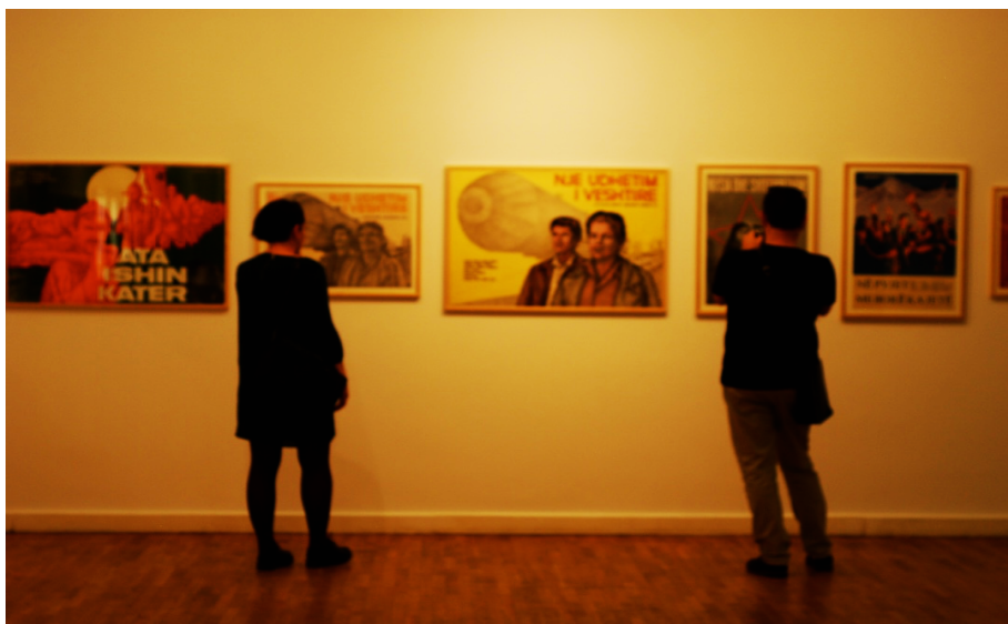
εικ. 3. Στιγμιότυπο από την έκθεση «Η τέχνη και το σχέδιο στις Αλβανικές ταινίες – Επιλεγμένα έργα από τα χρόνια του Kinosudio (κινηματογραφική Βιομηχανία Αλβανίας), η οποία πραγματοποιήθηκε τον Απρίλιο του 2016, στην Εθνική Πινακοθήκη των Τιράνων, εκθέτοντας χειροποίητες αφίσες από τις 100 πιο γνωστές ταινίες, για μικρούς και μεγάλους, που προβλήθηκαν στις αλβανικές αίθουσες κατά την κομμουνιστική περίοδο .

Εστιάζοντας τώρα στο πεδίο της πολιτιστικής παραγωγής, παρατηρεί κανείς ίσως την πιο συστηματική προσπάθεια μετάδοσης της πολιτικής ιδεολογίας. Ιδιαίτερα σημαντική ως προς αυτή τη κατεύθυνση ήταν η συμβολή του κινηματογράφου, ο οποίος, ακολουθώντας ως κυρίαρχο ρεύμα τον Σοσιαλιστικό Ρεαλισμό, υπήρξε «ένα από τα κύρια μέσα για τη δημιουργία της «νέας σοσιαλιστικής κοινωνίας» πάνω στα ερείπια της «παλιάς» (Puto 2012). Η αμεσότητα προς τον θεατή, η μαζική του απήχηση –καταργώντας τις συμβάσεις του χώρου και του χρόνου, και η δυνατότητα να διατηρείται υπό έλεγχο– σε αντίθεση με την λογοτεχνία, κατέστησαν το μέσο αυτό ως έναν από τους βασικούς θεσμούς της πολιτιστικής παραγωγής στη χώρα (Puto και Gjika 2008, Puto 2012) 14 .