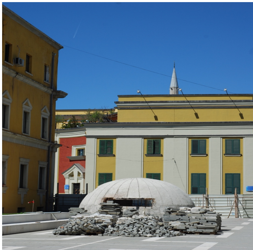
εικ. 23. Εικόνα από την υπό κατασκευή κεντρική είσοδο, τύπου Bunker, του Μουσείου – Τούνελ.

προκάλεσαν καταστροφές τόσο στο υπό κατασκευήν Bunker, όσο και στα κτήρια των υπουργείων που βρίσκονται γύρω του.