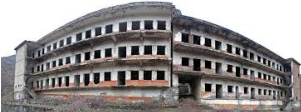
εικ. 12. Πρόσοψη της φυλακής του Srac (Burgu I Spacit) στη Βόρεια Αλβανία .

Ενδιαφέρον παράδειγμα αποτελεί και η περίπτωση της φυλακής του Srac, «Burgu I Spacit», το οποίο χτίστηκε το 1968 στη περιοχή της Mirdita στη βόρεια Αλβανία, σύμφωνα με το πρότυπο των σταλινικών γκουλάγκ, συνδυάζοντας τις σκληρές φυσικές συνθήκες με την καταναγκαστική εργασία στα ορυχεία. Οι απάνθρωπες συνθήκες του ορυχείου και το υψηλό κύρος ορισμένων πολιτικών κρατουμένων, στη πλειονότητά τους διανοουμένων, έδωσε στο μέρος αυτό μεγάλο συμβολικό βάρος, ενώ ένα επεισόδιο αντίστασης που σημειώθηκε από 21 έως 23 Μαΐου του 1973, όταν οι κρατούμενοι πήραν τον έλεγχο της φυλακής μέσω μιας γενικής εξέγερσης, μετέτρεψε τη φυλακή του Srac σε «ακρογωνιαίο λίθο της αλβανικής συλλογικής μνήμης», όπως χαρακτηριστικά αναφέρουν μέλη και υποστηρικτές της οργάνωσης CHwB 28 .