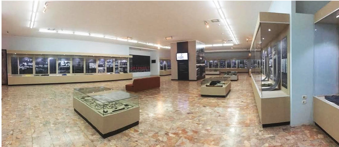
εικ. 10. Πανοραμική εικόνα της έκθεσης, Εθνικό και Ιστορικό Μουσείο Τυράνων.

Εστιάζοντας συγκεκριμένα στην εν λόγω έκθεση, αναφέρθηκε ότι αυτή παραμένει στον δεύτερο όροφο, ενώ παρά τον περιορισμένο χώρο που καταλαμβάνει, συγκριτικά με την προηγούμενη περίοδο, οι συλλογές 26 της έχουν εμπλουτιστεί με νέα αντικείμενα, αλλά και πλούσιο φωτογραφικό και αρχειακό υλικό 27 . Επιπλέον, οι ενότητες της αυξήθηκαν, ενώ ο χρονικός ορίζοντας στον οποίο αυτές αναφέρονται έχει διευρυνθεί, φτάνοντας έως και τα γεγονότα που σημειώθηκαν στις αρχές της δεκαετίας του 1990. Γενικά μιλώντας, πρόκειται για μια αφηγηματική έκθεση, η οποία διατηρεί σε σημαντικό βαθμό τον διδακτικό χαρακτήρα των παραδοσιακών εκθέσεων, ενώ τα ιστορικά τεκμήρια και οι φωτογραφίες που παρουσιάζονται σε αυτή υπόσχονται να αφηγηθούν την αντικειμενική αλήθεια της ιστορίας, μη