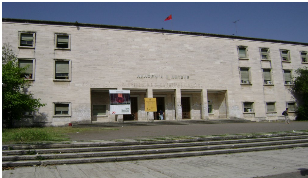
εικ. 4. Πρόσοψη της Εθνικής Ακαδημίας Τεχνών των Τιράνων.

Άλλο ένα σημαντικό μέσο μετάδοσης της ιδεολογίας, πλήρως προσανατολισμένο στις αρχές και τις πεποιθήσεις του Κόμματος, ήταν και το Ανώτατο Ινστιτούτο Τεχνών των Τιράνων το οποίο ιδρύθηκε το 1959, συμβάλλοντας στην υψηλού επιπέδου επαγγελματική κατάρτιση των νέων αλβανών καλλιτεχνών.