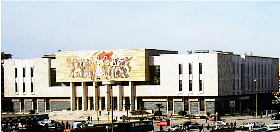
εικ. 2. Πρόσοψη του Εθνικού Ιστορικού μουσείου των Τιράνων.

Η ίδρυση, όμως, το 1981 του Εθνικού Ιστορικού Μουσείου των Τιράνων, όπως συνέβη άλλωστε και σε άλλες χώρες του ανατολικού μπλοκ, απεικονίζει με τον πιο γλαφυρό τρόπο την ιδεολογική μέριμνα του κράτους να ανιχνευτούν συνδέσεις με προηγούμενες ιστορικές περιόδους, στοιχείο το οποίο εκφράζεται στις αναπαραστάσεις των αρχαίων και των μεσαιωνικών χρόνων και στην επιβεβαίωση του έθνους ως μιας εθνικής και πολιτισμικής ενότητας που αγκάλιαζε το μακρινό παρελθόν, το κομμουνιστικό παρόν και το ιδεολογικά αισιόδοξο μέλλον (Vukon 2012: 121-124). Βασικός στόχος του Εθνικού Ιστορικού Μουσείου ήταν η παρουσίαση της ιστορίας της Αλβανίας, από την λίθινη εποχή ως την οικοδόμηση της τότε σοσιαλιστικής κοινωνίας (Adhami 2001: 51-53), τονίζοντας, όμως, πάντοτε τους δεσμούς της με τους αρχαίους λαούς της περιοχής. Αν και δεν υπάρχουν σαφείς αναφορές ως προς τη συγκρότηση των συλλογών του μουσείου, η αναφορά του Adhami ότι «εκεί βρίσκεται ό,τι πολυτιμότερο έχουμε» (2001: 52), κάνει φανερό ότι μάλλον βασίστηκε και σε μεταφορές από άλλα μεγάλα μουσεία της χώρας και κυρίως από το Αρχαιολογικό Μουσείο Δυρραχίου, το οποίο θεωρείται -έως και σήμερα- ότι έχει μια από της πιο πλούσιες αρχαιολογικές συλλογές της χώρας.