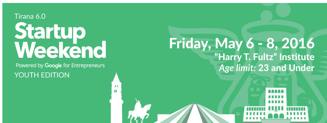
εικ. 14. Αφίσα από το τριήμερο εκπαιδευτικό σεμινάριο νέων που διοργανώθηκε στη πόλη των Τιράνων σχετικά με τις εξελίξεις στο πεδίο των startup και διεθνώς.

Η αποκαλούμενη Piramida (Πυραμίδα) αναφέρεται στο «Μουσείο του Enver Hoxha» 30 το οποίο χτίστηκε το 1988 (τρία χρόνια μετά το θάνατό του) προς τιμήν του έργου και της συμβολής του εν όσω ζούσε. Σχεδιασμένο το 1985 από την κόρη του Hoxha, Pranvera Kolaneci και το σύζυγο της Klement Kolaneci –διακεκριμένους αρχιτέκτονες της εποχής- το εν λόγω κτήριο διαφέρει ουσιαστικά από οποιοδήποτε άλλο κτήριο της μεταπολεμικής περιόδου. Ιδωμένο από τα πάνω, προτείνεται ως ένας «νέος γεωμετρικός ορισμός του αετού», ενώ από την οπτική των περαστικών, δείχνει να μοιάζει με «μια αιγυπτιακή πυραμίδα που έχει ανοίξει τα “φτερά” της» (Hoxha 2014: 383) 31 . Τα ιδιαίτερα αυτά αρχιτεκτονικά χαρακτηριστικά, καθώς και η τοποθεσία του στο κέντρο των Τιράνων, έχουν μετατρέψει κυριολεκτικά την Piramida σε σημείο αναφοράς της πόλης, ενώ όλο και περισσότερο τα τελευταία χρόνια, το συναντά κανείς σε τουριστικά σποτ και ταξιδιωτικούς οδηγούς ή ακόμη και σε αφίσες προώθησης εκδηλώσεων εσωτερικής κατανάλωσης.