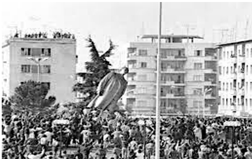
εικ. 7. Στιγμιότυπο από την πτώση του επιβλητικού αγάλματος του Enver Hoxha στην κεντρική πλατεία Τιράνων.

Η αλλαγή του πολιτικού συστήματος στην Αλβανία έχει αποτυπωθεί στη μνήμη των πολιτών της χώρας με την εκβαράθρωση του επιβλητικού αγάλματος του Enver Hoxha στην κεντρική πλατεία των Τιράνων, συμβολίζοντας με αυτό τον τρόπο και τη μεταφορική πτώση ενός «ολοκληρωτικού καθεστώτος». Η ευφορία που διακατείχε τα πλήθη και κυρίως η πεποίθηση των νέων ότι «επιτέλους» μια νέα εποχή ανοίγεται μπροστά τους, κατά την οποία οι δημοκρατικές αξίες θα υπερισχύσουν έναντι των καταπιεστικών πρακτικών του προηγούμενου συστήματος, συμβάδιζαν κατά κάποιο τρόπο με τον φόβο και την ανασφάλεια άλλων, για τις εξελίξεις που επρόκειτο να ακολουθήσουν τα παραπάνω γεγονότα. Και είναι αλήθεια ότι όσα ακολούθησαν μετά το 1990, μάλλον επιβεβαίωσαν τους πιο σκεπτικούς, δείχνοντας έτσι ότι η διαδικασία μετάβασης και το άνοιγμα των συνόρων με άλλα κράτη της Δύσης, δεν μπορούσε παρά να είναι μια επίπονη, μακρά και σχεδόν ατέρμονη διαδικασία, η οποία συνεχίζει ακόμη και σήμερα να απασχολεί τους ιθύνοντες της χώρας.