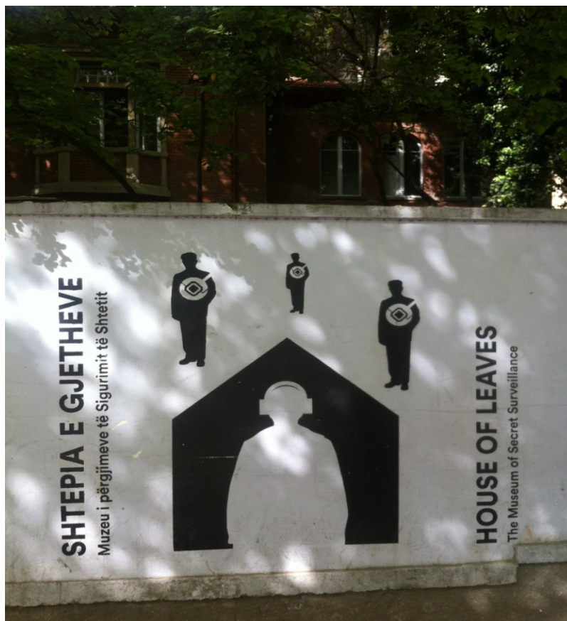
εικ. 22. Λεπτομέρεια από την μπροστινή περίφραξη του Gjethi.

συνολική συνεισφορά του γερμανικού κράτους, τονίζοντας ιδιαίτερα την στενή και συνεχή συνεργασία με το Μουσείο Στάζι (Stasi Museum) στο Ανατολικό Βερολίνο, το οποίο, αποτελεί πρότυπο έργο στη διαδικασία μουσειοποίησης του κτηρίου, η οποία αναμένεται να ολοκληρωθεί εντός του 2016.