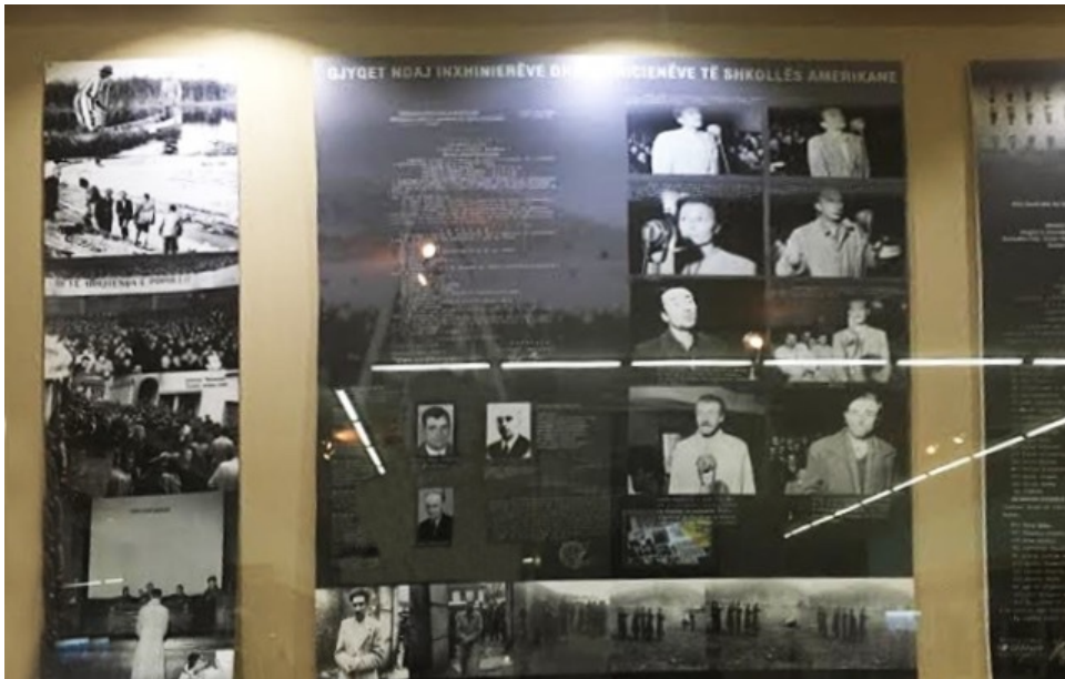
εικ. 9. Λεπτομέρεια από τις προθήκες της έκθεσης, όπου πέρα από τα χειρόγραφα, δίνονται και οπτικά ντοκουμέντα με στιγμιότυπα από τις δίκες πολιτικών κρατουμένων.

Η παραπάνω περίπτωση μπορεί να θεωρηθεί και ως μια αντίδραση που εφορμάται κυρίως από τον πυρετό της λεγόμενης «νέας εποχής», στην οποία μετέβη η Αλβανία στις αρχές της δεκαετίας του 1990. Παράλληλα, όμως, ως η πρώτη κρατική πρωτοβουλία η οποία ασχολείται με το κομμουνιστικό παρελθόν της χώρας, μπορεί να θεωρηθεί η δημιουργία της μόνιμης έκθεσης Pavijoni i Genocidit» (Το περίπτερο της Γενοκτονίας) , η οποία εγκαινιάστηκε τον Μάιο του 1996 στον δεύτερο όροφο του Εθνικού Ιστορικού Μουσείου Τιράνων, και αναπαρίστανε τη λεγόμενη «σκοτεινή πλευρά του καθεστώτος». Σύμφωνα με τους συνεντευξιαζόμενους, η συγκρότηση των συλλογών της, είχε βασιστεί κυρίως σε καθημερινά αντικείμενα πρώην πολιτικών κρατουμένων, τα οποία ως επί το πλείστον προσφέρθηκαν στο μουσείο ως δωρεά από τους ίδιους ή τις οικογένειές τους. Επίσης, συμπεριλαμβάνονταν και υλικά τεκμήρια από όλους τους τόπους εξορίας ή κράτησης της χώρας, καθώς και πολλά χειρόγραφα και άλλα επίσημα έγγραφα, τα οποία συγκεντρώθηκαν από τα αρχεία του Υπουργείου Εσωτερικών.