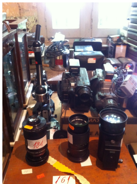
εικ. 21. Λεπτομέρειες από ορισμένα από τα αντικείμενα που βρέθηκαν στο κτήριο και αναμένεται να χρησιμοποιηθούν ως εκθέματα κατά την μουσειοποίηση του Gjethi.

Εστιάζοντας στις συνεργασίες των συντελεστών αυτής της πρωτοβουλίας, τόσο με την κοινωνία των πολιτών όσο και με εξωτερικούς παράγοντες του πολιτισμού, βρήκα σημαντική την αναφορά στην στήριξη που έλαβε το έργο από το ΙΜΕΣΚ, καθιστώντας διαθέσιμο οπτικοακουστικό υλικό με μαρτυρίες πρώην πολιτικών κρατουμένων, το οποίο αναμένεται να χρησιμοποιηθεί στο νέο αυτό μουσείο. Κάτι τέτοιο δείχνει σαφώς μια διάθεση διαλόγου εκ μέρους τους, η οποία θα μπορούσε δυνητικά να προσφέρει την απαραίτητη πολυφωνία και τον εκδημοκρατισμό στη διαδικασία λήψης αποφάσεων, ωστόσο, όπως μου ανέφεραν, αυτή φαίνεται να βρίσκεται ακόμη σε πρώιμο στάδιο και ενδεχομένως να χρειάζεται ακόμη χρόνος για να επιτευχθεί. Ως προς τις συνεργασίες με το εξωτερικό, ως ανωτέρω συνεντευξιαζόμενος ανέφερε τη