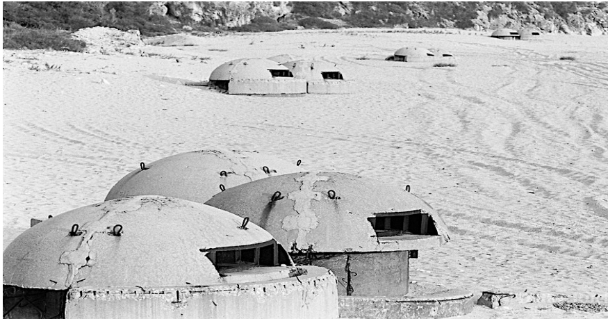
εικ. 6. Λεπτομέρεια από αντιατομικά καταφύγια, τύπου Bunker, στη Βόρεια Αλβανία.

Παρά το ότι η παραπάνω περιγραφή δεν μπορεί και δεν δύναται να αναλύσει σε βάθος όλα τα παραδείγματα και κυρίως τις πρακτικές, έτσι όπως αυτές αποτυπώθηκαν στο πεδίο της πολιτιστικής παραγωγής κατά τη διάρκεια της διακυβέρνησης Hoxha, δανειζόμενη τους όρους από τον Άντερσον (1997), θα ήθελα να τονίσω ότι αυτές ήταν τόσο έντονα και σε τόσο βαθύ επίπεδο πολιτικές, ώστε ακόμη και όσοι εμπλέκονταν άμεσα στην παραγωγική διαδικασία δεν φαίνεται να είχαν απόλυτη συνείδηση των γεγονότων. Ήταν όμως αυτή η ατέλειωτη, καθημερινή, αναπαραγωγή συμβόλων που αποκάλυπτε την αληθινή δύναμη του κράτους. Στο πλαίσιο της «φαντασιακής» κατασκευής της κοινωνίας του Hoxha, ο συνδυασμός της κομμουνιστικής με την εθνική ιδεολογία, ιδωμένη και ως κοσμική θρησκεία, συνετέλεσε καθοριστικά στην φυσικοποίηση κάθε εθνικής αλήθειας (Άντερσον 1997: 263-269; Χαμηλάκης 2007: 40-41). Η χρήση του υλικού πολιτισμού –ως αδιαμφισβήτητης απόδειξης της συνέχειας του έθνους– σε συνδυασμό με την επίκληση της επιστημονικής γνώσης, δημιούργησαν έναν εικονικό κόσμο για τους Αλβανούς. «Όμως με τη πάροδο του χρόνου, αυτές οι επιβεβαιώσεις έγιναν όλο και περισσότερο υποκριτικές, καθώς η εθνική κομμουνιστική ιδεολογία γινόταν όλο και περισσότερο «μια πίστη που δεν πιστεύονταν», ενώ το πνεύμα των ανθρώπων άρχισε σταδιακά να ανοίγεται προς άλλους μύθους» (Lubonja 2012: 161-169). Η σχεδόν βίαιη, μαζική καταστροφή κάθε στοιχείου που συμβόλιζε το προηγούμενο καθεστώς, αλλά κυρίως η εκβαράθρωση των «κομμουνιστών ηρώων» από τα