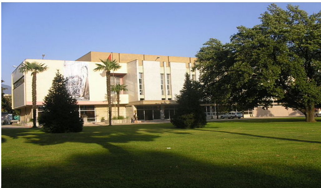
εικ. 5. Πρόσοψη της Εθνικής Πινακοθήκης των Τιράνων.

και την κατανάλωσή του. Αυτή η πολιτική ήταν σαφώς αντίθετη με το δυτικό πρότυπο, όπου η πολιτιστική «διάκριση» σε ένα «ανώτερο» και σε ένα «κατώτερο» κοινό (με όρους ταξικούς), οριοθετημένη στη λειτουργία του «καλού γούστου», αποτελούσε βασικό άξονα της πολιτιστικής πολιτικής των περισσότερων χωρών.