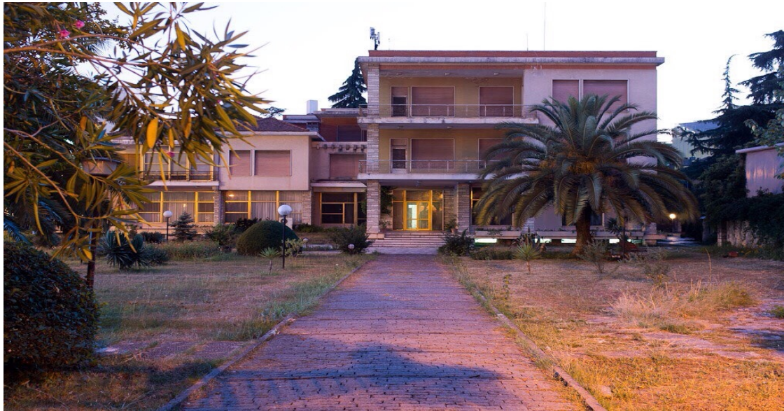
εικ. 8. Πρόσψη της οικίας του Enver Hoxha στην περιοχή Blloku.

Η ονομασία της περιοχής παραμένει έως και σήμερα «Blloku» - αν και για άλλους είναι το «ish-blloku» (πρώην – blloku). Αν υπάρχει κάτι που διατηρήθηκε ανέπαφο, παρά τη φθορά του χρόνου, αυτό είναι η πρώην κατοικία του Enver Hoxha στο κεντρικότερο σημείο της περιοχής, το οποίο όμως ελάχιστοι γνωρίζουν. Παρά τις διάφορες καλλιτεχνικές προσπάθειες που σημειώθηκαν τα τελευταία χρόνια, ώστε το κτήριο αυτό να ανοίξει για το κοινό ως εκθεσιακός χώρος, παραμένει κλειστό, ενώ, σύμφωνα με συνεντευξιαζόμενο από το Υπουργείο Πολιτισμού, αναμένεται να μετατραπεί σύντομα σε μουσείο, χωρίς ωστόσο να αναφερθούν περαιτέρω λεπτομέρειες.