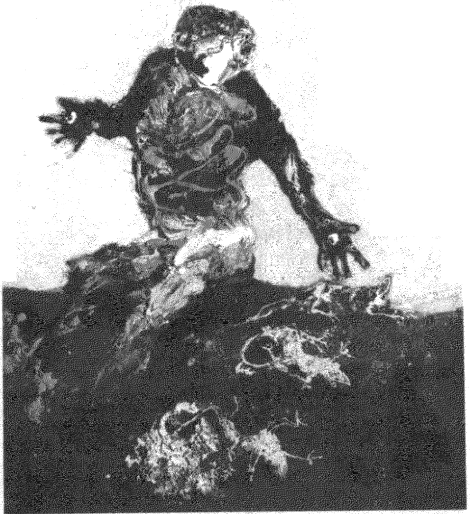
PAUL REBEYROLLE: «Αύριο όλα θα πάνε καλά», 1987