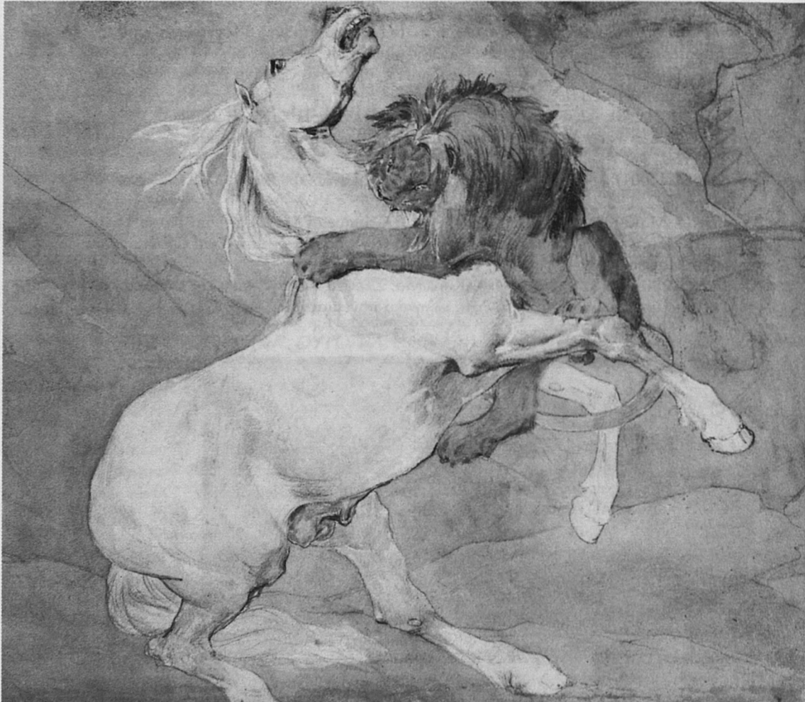
Τ. Ζερικό, Λιοντάρι επιτίθεται σε άλογο.

(1987) Capital New York (London: Penguin Books). Μαρκοβίτης, Γ. (2005) Τα άρρωστα κοινότητες: Η κοινωνία και η υγεία . Μάκκινσι, Ρ. and J. Wainman (1997) The Social Structure of Technology . Philadelphia: Open University Press. Μάκκινσι, Τ. (2002) Value Wars: The Global Market Versus the Environment . London: Routledge. Μάκκινσι, Τ. (1993) Environment and Economic Policy . London: Routledge. Μιττσένμποντ, Σ. et al. (1998) New Agricultural Biotechnologies: The Strategic for Domestic Choice . Monthly Review, 50(1), 8-20. Νόβλε, Ν. (1995) Progress Without Power: New Technology, Unemployment and the Message of Resistance . Toronto: Between the Lines. — (1998) Digital Dilemma: The Struggle for the Soul of the Internet . Toronto: Between the Lines.