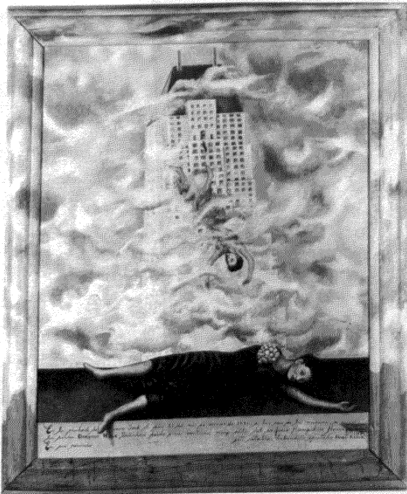
FRIDA KAHLO: «Η αυτοκτονία της Dorothy Hale», 1939.