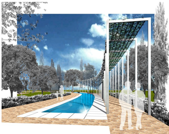
ροδόνας (εικ. 1)