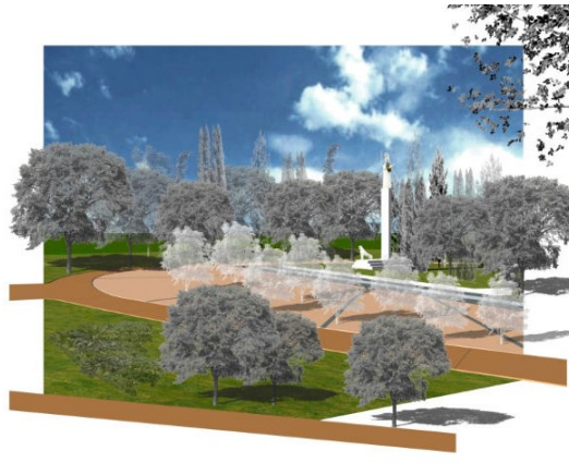
ελαιώνας μπροστά από το άγαλμα της Αθηνάς (εικ.4)

Πριν αναφερθούμε στην τρίτη βασική αρχή της ανάπλασης, θα επιχειρηθεί ένας μικρός σχολιασμός επί των φωτογραφιών-μακετών που δημιουργήθηκαν από το αρχιτεκτονικό γραφείο του Αλέξανδρου Τομπάζη. Με μια πρώτη ματιά, οι μακέτες αυτές μας δείχνουν πώς οραματίζονται οι αρχιτέκτονες το πάρκο μετά την περάτωση του έργου. Είναι ένα κολλάζ φωτογραφίας και σχεδίου που προσδίδει ρεαλιστικότητα και δίνει την αίσθηση της ζωντάνιας. Τα καινούρια δέντρα και φυτά απεικονίζονται στη μακέτα με φωτογραφίες σε ασπρόμαυρα χρώματα, ο ουρανός είναι φωτογραφημένος στις φυσικές