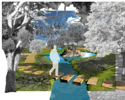
υδάτινη διαδρομή (εικ. 2)