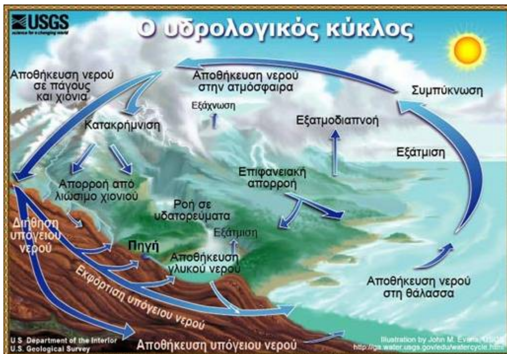
Εικόνα 2: Υδρολογικός Κύκλος.

λίμνες και αποτελεί την κύρια πηγή εφοδιασμού 40 . Το νερό βέβαια στην φύση ανακυκλώνεται και ο υδρολογικός κύκλος περιγράφει αυτή την ανακύκλωση.