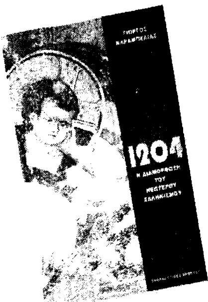
ΓΙΩΡΓΟΣ ΚΑΡΑΜΠΕΛΙΑΣ ΤΟ 1204 ΚΑΙ Η ΔΙΑΜΟΡΦΩΣΗ ΤΟΥ ΝΕΩΤΕΡΟΥ ΕΛΛΗΝΙΣΜΟΥ