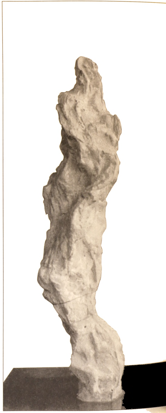
Ελένη Αποστολοπούλου, Μορφή σε 4 όψεις, κίτρινος γύψος. Μια ελικοειδής εσωτερική κίνηση του πυρήνα μιας γυναικείας μορφής.