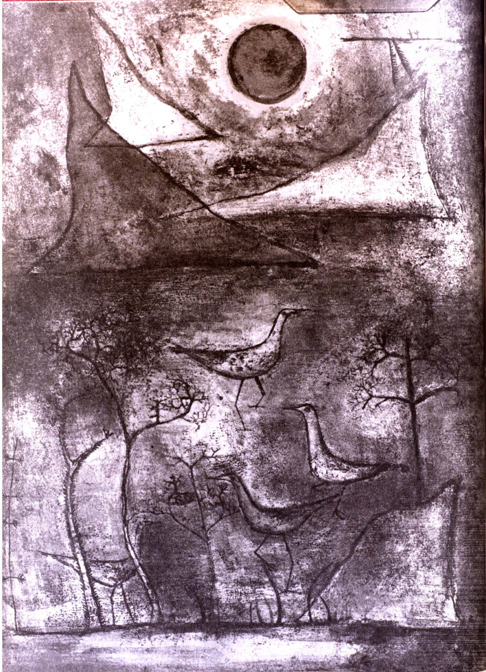
Zao Wou-Ki, Βουνά και πουλιά, λιθογραφία, 4 χρώματα, 1951