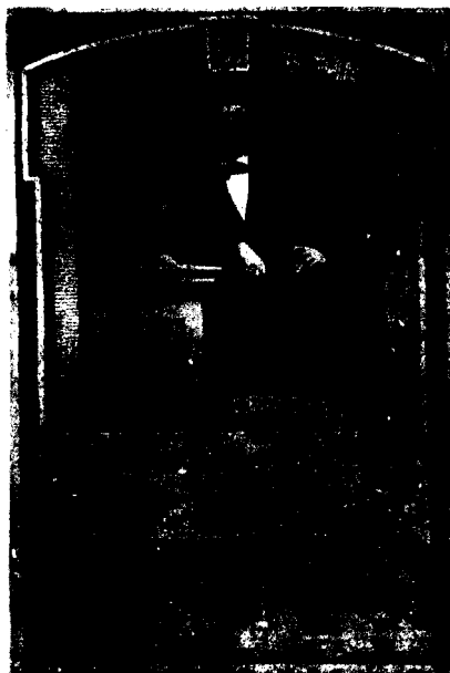
Ὁ Χριστιανός Χάνσεν. Σχέδιο του Edvard Lehmann, 1845. Μουσείο Frederiksborg, Δανία.