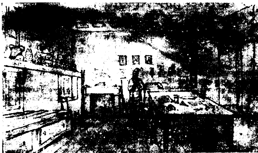
Χρ. Χάνσεν, Τό δωμάτιο του Σάονμπεργκ στην Ἀθήνα, Φεβρουάριος 1834. Ἀκαδημία Καλών Τεχνών, Τετράδιο σκίτσων, σελ. 51.