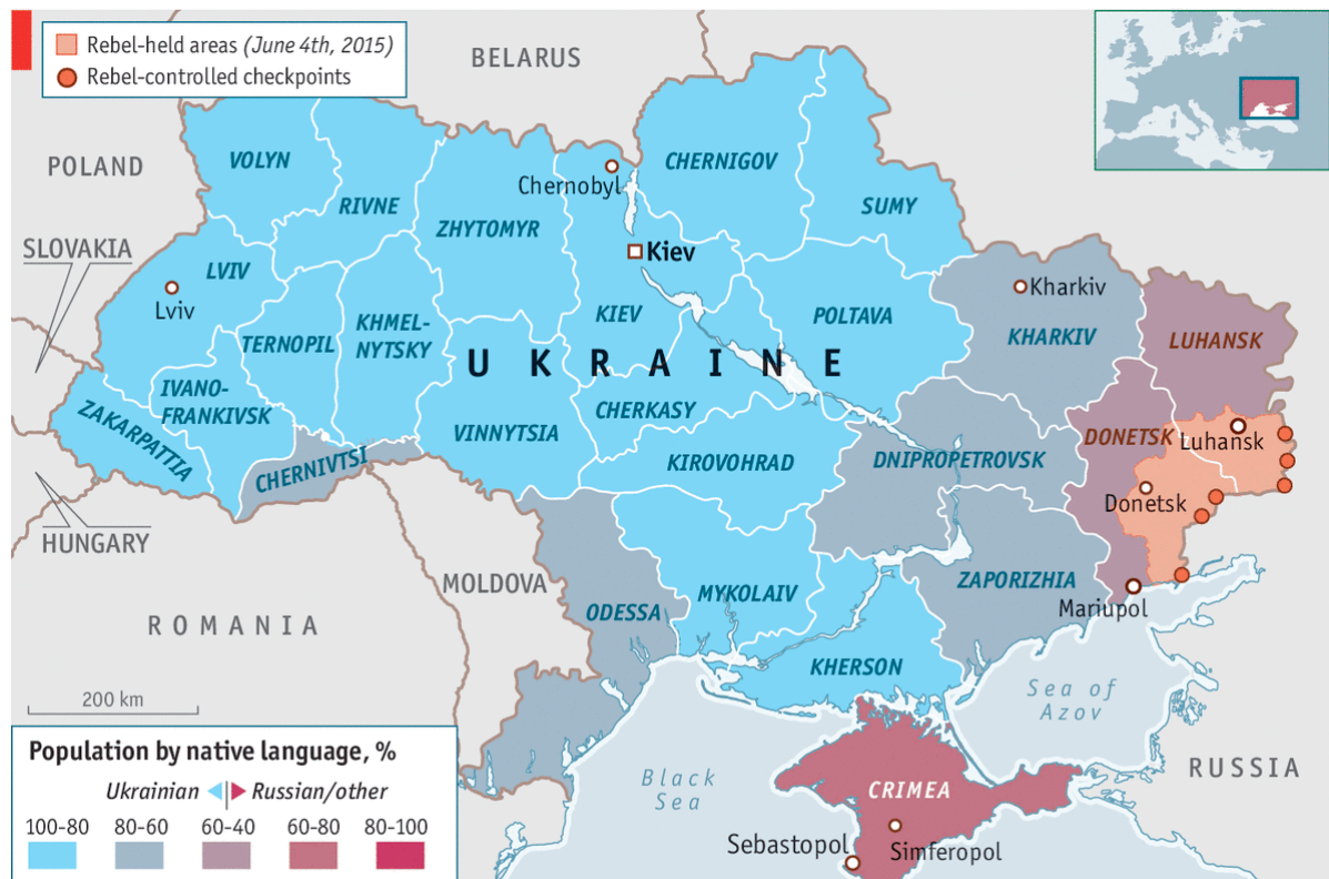
Χάρτης 1: ποσοστό πληθυσμού ανάλογα με την μητρική γλώσσα