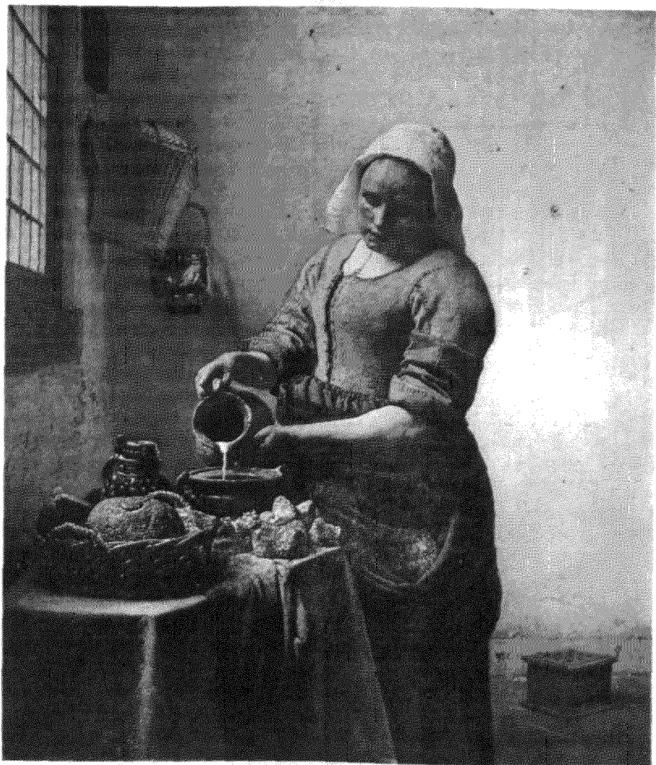
Γιοχάνες Βερμέερ: Η γαλατού (χρονολογείται γύρω στα 1656 - 1660). Άμστερνταμ, Βασιλικό Μουσείο.