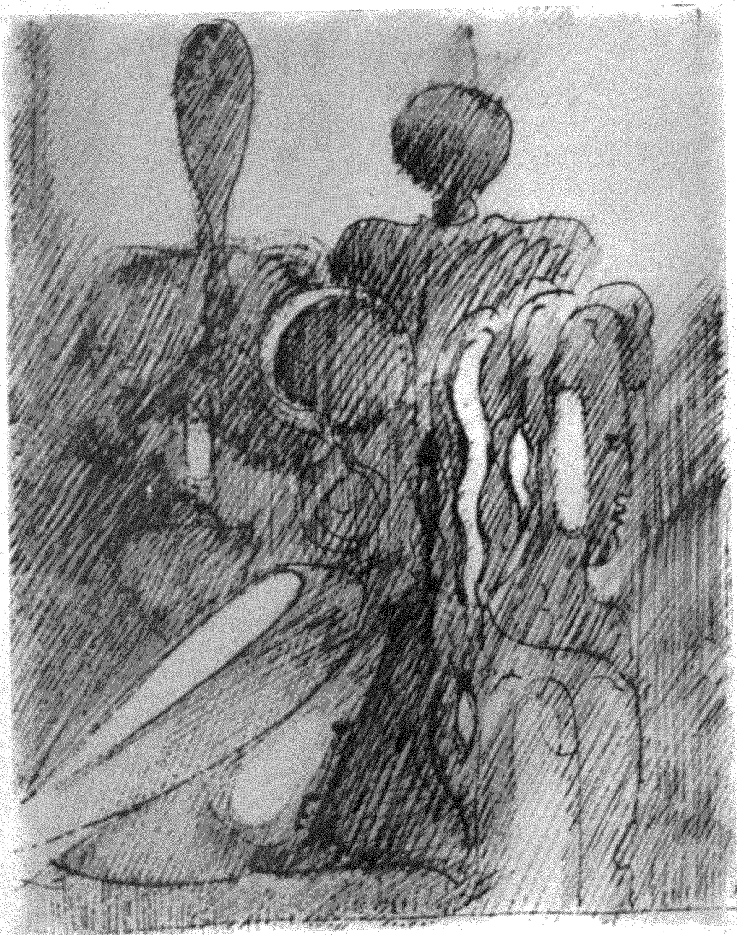
OSKAR SCHLEMMER: Τέσσερις στη σκιά . 1936.