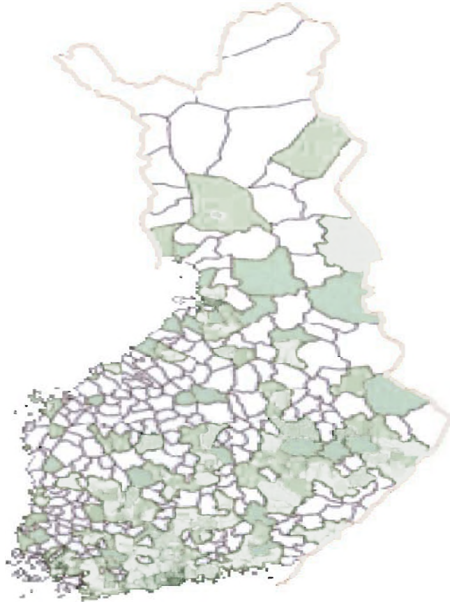
Votes received by the Green League in municipal elections 2004 - Wikipedia