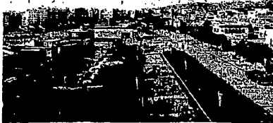
— Η ανακωνική έκθεση επί της οδοῦ Σπυριδίου. Η ἐκθέσις, ἐν ἰσχυρῶν ἐπιπέδῳ ἐπὶ τῆς ἐπιπέδου ὁδοῦ Σπυριδίου καὶ ἰσοπέδου ἐπιπέδου ἐπὶ τῆς οδοῦ Σπυριδίου.