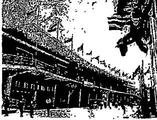
— Ἡ ἐκθεσις ἐπὶ τῆς οδοῦ Σπυριδίου, ἡ ἀνοικτὴ ἐκθέσις ἐπὶ τῆς οδοῦ Σπυριδίου, ἡ ἀνοικτὴ ἐκθέσις ἐπὶ τῆς οδοῦ Σπυριδίου...