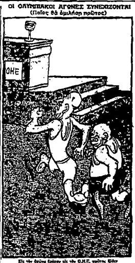
ΟΙ ΟΛΥΜΠΙΑΚΟΙ ΑΓΩΝΕΣ ΣΥΝΕΧΙΖΟΝΤΑΙ (Πόλεξ έξι όμιλοι πρώτοι)

ΕΙΣ ΜΗΝΥΜΑ ΑΠΟ ΤΟΥ ΑΤΜΟΠΛΟΙΟΥ «ΒΑΛΤΙΚΗ» ΤΟΝΙΖΕΙ ΟΤΙ «ΘΑ ΉΛΘΗ ΜΙΑ ΚΑΛΥΤΕΡΑ ΕΠΟΧΗ» ΕΙΣ ΤΑΣ ΣΧΕΣΕΙΣ 'ΗΝ. ΠΟΛΙΤΕΙΩΝ ΚΑΙ ΡΩΣΙΑΣ Ο ΑΜΕΡΙΚΑΝΟΣ ΠΡΟΕΔΡΟΣ ΕΜΜΕΝΕΙ ΕΙΣ ΤΗΝ ΑΡΝΗΣΙΝ ΤΟΥ ΚΑΙ ΤΥΠΙΚΗΝ ΧΕΙΡΑΦΙΑΝ ΑΚΟΜΗ ΝΑ ΑΝΤΑΛΛΑΞΗ ΜΕ ΑΥΤΟΝ ΕΚΤΟΣ ΑΝ ΕΚΠΑΗΡΩΘΟΥΝ ΟΙ ΤΕΘΕΤΕΣ ΠΡΟ ΕΒΔΟΜΑΔΟΣ ΟΡΟΙ