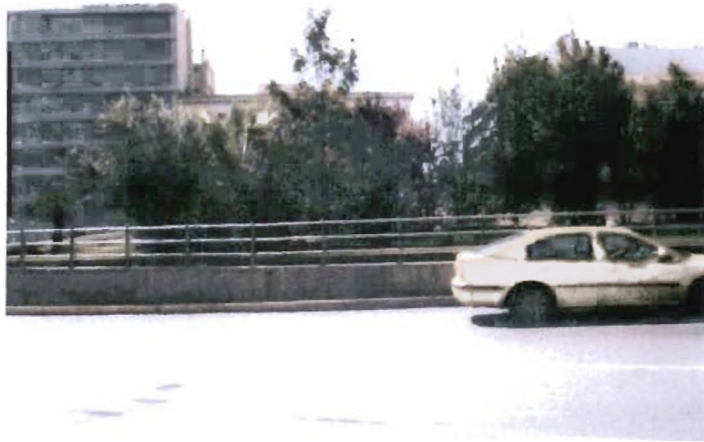
Ομόνοια: παράδειγμα υπερυψωμένης πλατείας πάνω από το επίπεδο των οδών.

πλατείες στην Αθήνα που κατά κύριο λόγο διασχίζονται 76 , αντί να χρησιμοποιούνται ως τόποι στάσης, ανάπαυσης και κοινωνικής επαφής. Το πιο χτυπητό παράδειγμα τέτοιας πλατείας στην Αθήνα είναι η Ομόνοια, την οποία μάλιστα φρόντισαν να υψώσουν αρκετά πάνω από το επίπεδο των γύρω οδών προκειμένου να απομονωθεί και να ενισχυθεί ακόμα περισσότερο η αχρηστία της 77 . Ο Richard Sennet παρατηρεί ότι είναι τέτοιος ο βαθμός ανενέργειας που περιβάλλει αυτού του είδους τις πλατείες ώστε αν τύχει και καθίσει κανείς σε κάποιο από τα παγκάκια της, “περιέρχεται σε μεγάλη αμηχανία, ωσάν να αποτελούσε έκθεμα σε κάποια αχανή αίθουσα”.