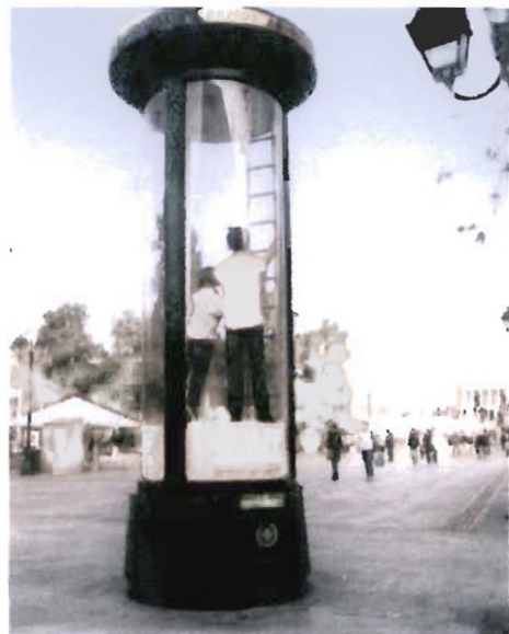
Μετρό Πανόρμου και πλατεία Συντάγματος: δεσπόζουσες διαφημιστικές προθήκες με τις ευλογίες του Δήμου Αθηναίων.