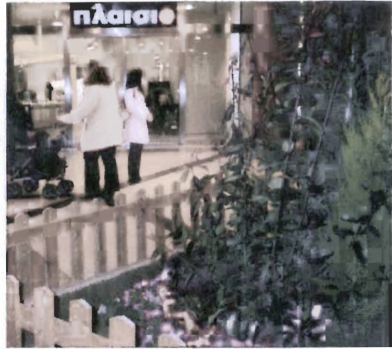
Προσομοίωση πάρκου στο The Mall Athens: Η εικόνα της κυρίας με το καρότσι παραπέμπει σημειολογικά στον πραγματικό δημόσιο χώρο.

Ωστόσο υπάρχει ισχυρός αντίλογος που αρνείται κατηγορηματικά κάθε δημόσια διάσταση αυτών των κέντρων. Η Naomi Klein μιλάει για “γκρίζα ζώνη ψευδο-δημόσιου ιδιωτικού χώρου” 139 καθώς το περιβάλλον του mall αποτελεί ταυτόχρονα πεδίο εμπορευματοποιημένης ψυχαγωγίας και τόπος συνάντησης των κατοίκων της πόλης. Στην ουσία δηλαδή πρόκειται για μια τέλεια εννοησιμότητα εξαπάτησης του ατόμου ότι μπορεί στον ίδιο χώρο να συγκεράσει την ιδιότητα του πολίτη και του καταναλωτή. Το πρώτο και βασικό επιχείρημα που τεκμηριώνει αυτή την τοποθέτηση είναι η ερμητική περιήγηση του χώρου και η δυνατότητα απαγόρευσης εισόδου σε κατηγορίες ανεπιθύμητων ατόμων. Η πρόσβαση ελέγχεται από την επιχείρηση και οι κανόνες που τη ρυθμίζουν ορίζονται μονομερώς και χωρίς διαπραγματεύσεις από την ίδια 140 . Ουδέποτε θα επιτραπεί η είσοδος σε διαδηλωτές που θέλουν να διαμαρτυρηθούν ή σε επαίτες που μένουν στο δρόμο και ζητιανεύουν χρήματα. Κάθε φορά που θα προκληθεί κάποια αναταραχή, τα σώματα της ιδιωτικής αστυνομίας που ευθύνονται για την τήρηση της τάξης θα επέμβουν άμεσα και θα απομακρύνουν