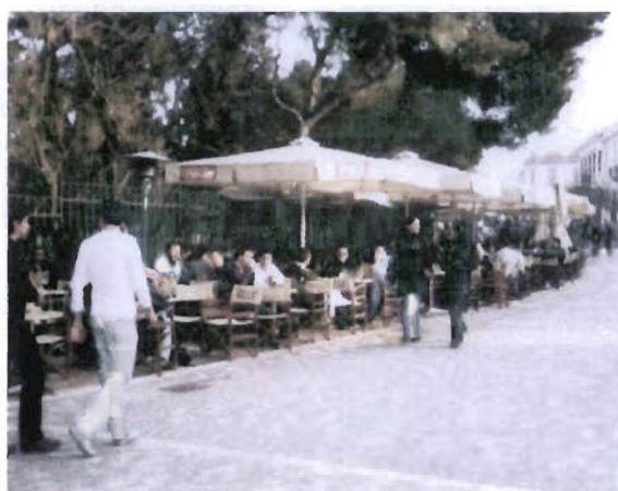
Θησείο-Μοναστηράκι: ασύδοτη κατάληψη του δημόσιου χώρου από τις παρακείμενες καφετέριες.

Το πονηρό marketing αυτών των εταιριών αναπτύσσεται γύρω από την απλή ιδέα ότι οι δημόσιοι χώροι συγκεντρώνουν περισσότερο κόσμο κι έτσι έχουν μεγαλύτερες πιθανότητες να “ψαρέψουν” πελάτες, παρά αν δραστηριοποιούνταν σε απομακρυσμένα σημεία της πόλης με δύσκολη πρόσβαση και χωρίς ανοιχτό χώρο για να τον εκμεταλλευτούν και να απλωθούν. Αντίθετα, μια πλατεία, εκτός από τη μόνιμη ροή κόσμου, παρέχει και μια μοναδική δυνατότητα επέκτασης: τα τραπεζοκαθίσματα εξαπλώνονται αδιάκριτα και μπορούν να αυξηθούν δραματικά όταν η προσέλευση του κόσμου το απαιτεί. Έτσι ο ιδιωτικός χώρος εισχωρεί σταδιακά μέσα στο δημόσιο και τον καταργεί, τον καθιστά κι εκείνον ιδιωτικό. Η πόλη ολόκληρη παραδίδεται χωρίς μάχη στα χέρια του ιδιώτη για να τη διαχειριστεί με τον πιο επικερδή τρόπο. Κι αν η πραγματικότητα της Celebration City, μιας απόλυτα ιδιωτικοποιημένης πόλης στη Florida κατασκευασμένη από την εταιρία Disney 121 , φάνταζε κάποτε εφιαλτική και πολύ τραβηγμένη για να γενικευτεί ως καθολικό πρότυπο πόλης, όλα δείχνουν