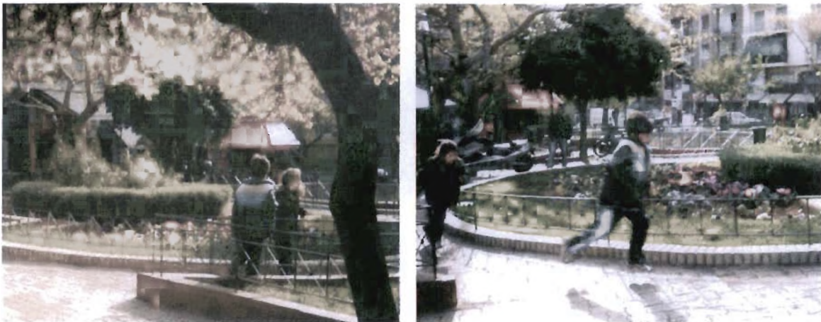
Φωκίωνος Νέγρη: Τα καγκελάκια γύρω από το γκαζόν κρατούν τα μικρά παιδιά μακριά από κάθε επαφή με την (ούτως ή άλλως τεχνητή) φύση.

νόμους της αγοράς όπου όλα αποτιμώνται με μέτρο το βαθμό δυνητικής κατανάλωσης.