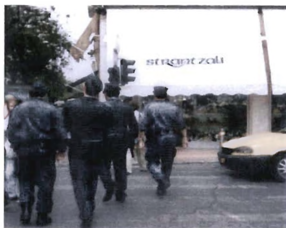
Πλατεία Βικτωρίας: σταθμευμένο βανάκι της δημοτικής αστυνομίας. Τετράδα αστυνομικών εν ώρα υπηρεσίας-περιπολίας σε κεντρικούς δρόμους της πόλης.

Αναμένεται τώρα το επόμενο στάδιο αυτής της κατασταλτικής μεθόδευσης. Μπορεί προς το παρόν να είναι ο αστυνομικός της γειτονιάς που