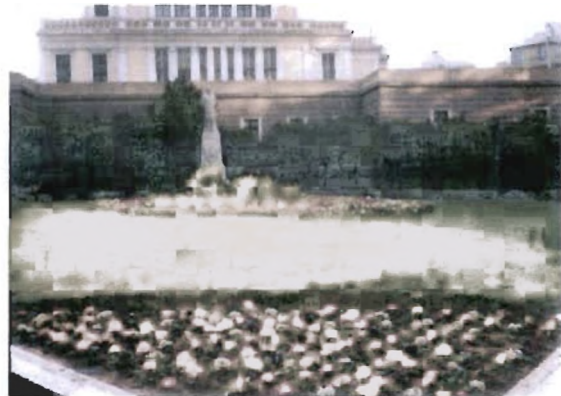
Πλατεία Καραϊσκάκη (Μεταξουργείο) και πλατεία Κολοκοτρώνη (Σταδίου): πολύχρωμα παρτέρια στοιχισμένα με μαθηματική ακρίβεια - θεαματικός δημόσιος χώρος.