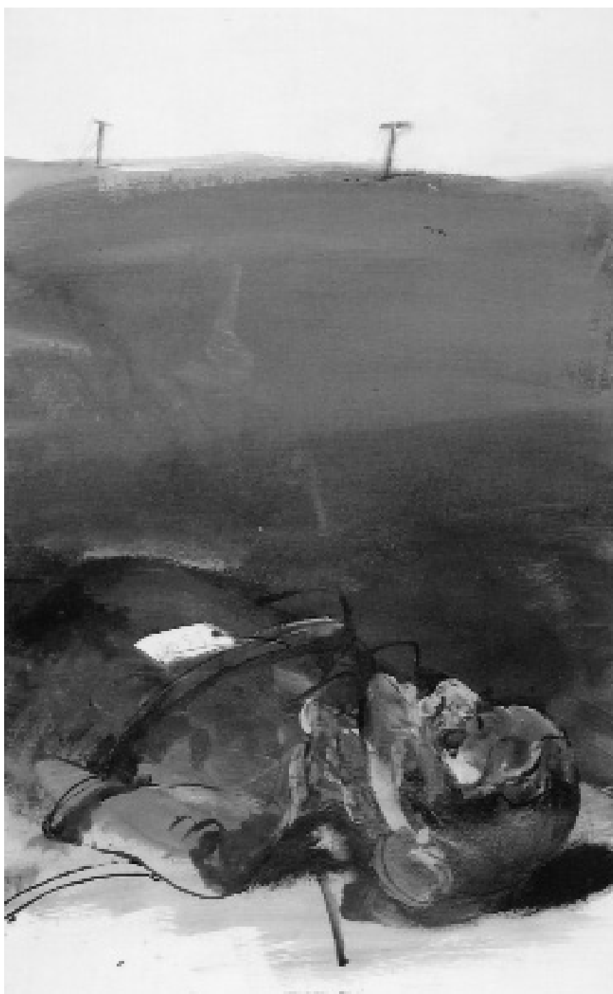
1993. Τοπίο 3/26. Μικτή τεχνική σε χαρτί.