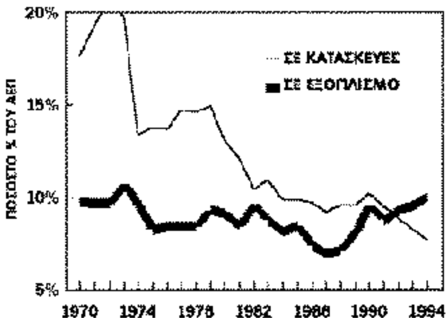
Διάγραμμα 1 Επενδύσεις πάγιου κεφαλαίου