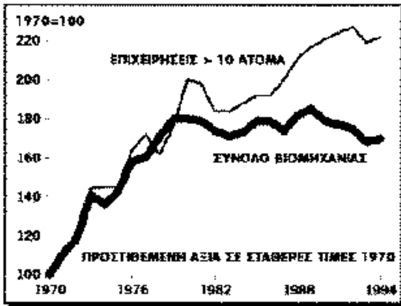
Διάγραμμα 4 Βιομηχανική παραγωγή