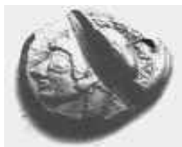
κίβδηλο αθηναϊκό νόμισμα αρχαϊκής εποχής, χαραγμένο από τον αρχαίο δοκιμαστή (τέλη 6ου, αρχές 5ου αι. π.Χ.)

εκτός τις μέρες που γινόντουσαν δημόσιες πληρωμές, οπότε πήγαινε στο Βουλευτήριο.